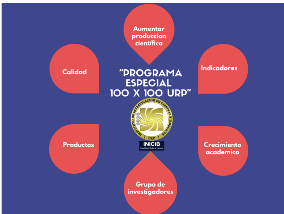
Figura 2. Programa Especial 100 x 100 URP.