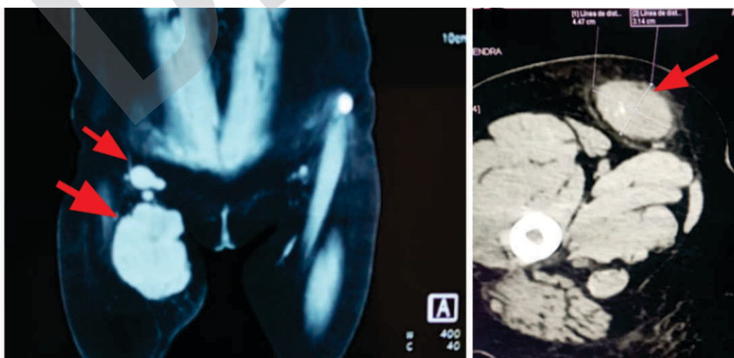
Figura 1. 1A: Resonancia magnética: Se observa imagen expansiva amplia con aproximadamente 9 x 5 cm en ingle derecha con ganglios; 1B: Tomografía espiral multicorte, postratamiento de quimioterapia de inducción donde tumoración que se reduce a 4 x 3 cm aproximadamente

Los resultados de los exámenes de imagen mostraron: lesión neoformativa con captación heterogénea de la sustancia de contraste (mide aprox 9 cm x 5 cm), aumento de la densidad de la grasa, adenopatías inguinales profundas, sin compromiso vascular, ni muscular, ni óseo (figura 1A).