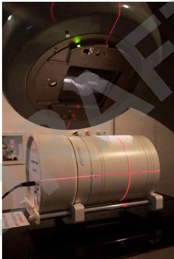
Figura 2. Posicionamiento del ArcCheck para la reproducción de un planeamiento con arcos dinámicos.

Para las distribuciones de dosis, los parámetros de los planeamientos fueron exportados y simulados experimentalmente por la matriz de diodos ArcCheck. Asociado al ArcCheck, el software SNC Patient™ proyecta la medición en la superficie cilíndrica en un plano y la muestra de manera similar a una matriz plana (2D), que puede ser reconstruida para una matriz tridimensional (13-15) .