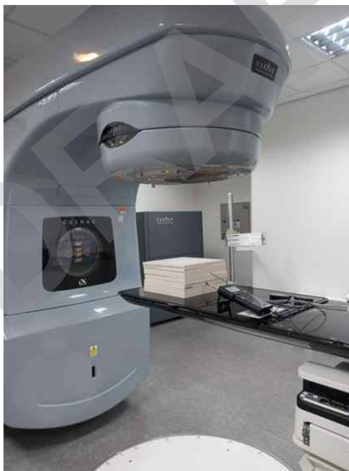
Figura 1. Posicionamiento de la cámara de ionización en el objeto simulador de agua sólida.

El sistema de planificación computarizada o TPS utilizado fue el Eclipse versión 15.5 (Varian Medical Systems, Palo Alto, CA, EE. UU.).