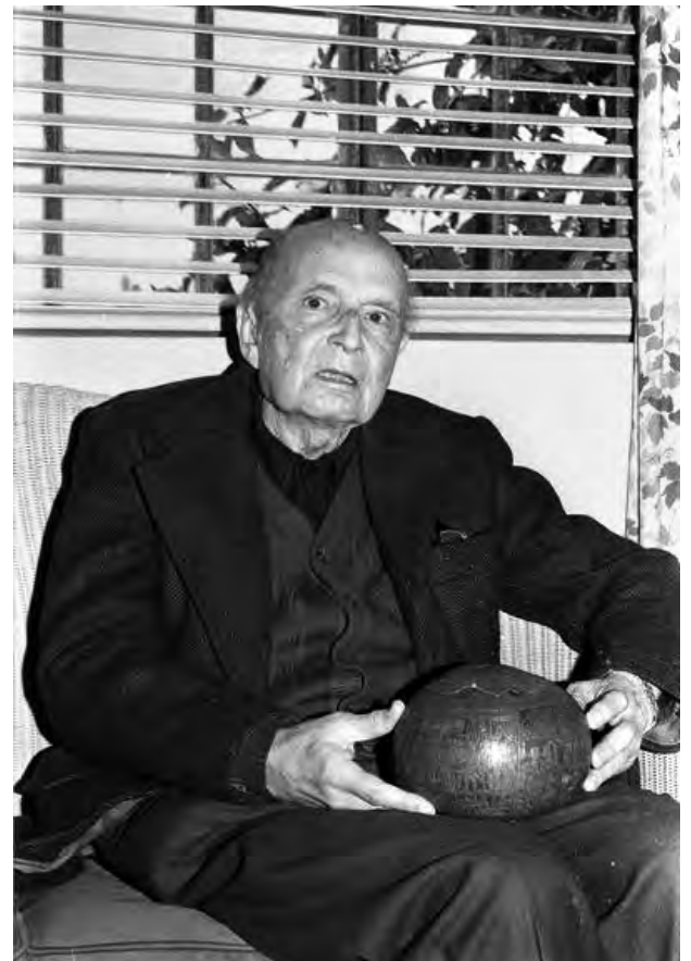
Jorge Basadre y el mate peruano. https://cultura.petroperu.com.pe/noticia/jorge-basadre-grohmann-118-anos-de-nacimiento/

Significativo resulta el hecho de cerrarse el libro con un capítulo esperanzador: “Basadre y la educación para