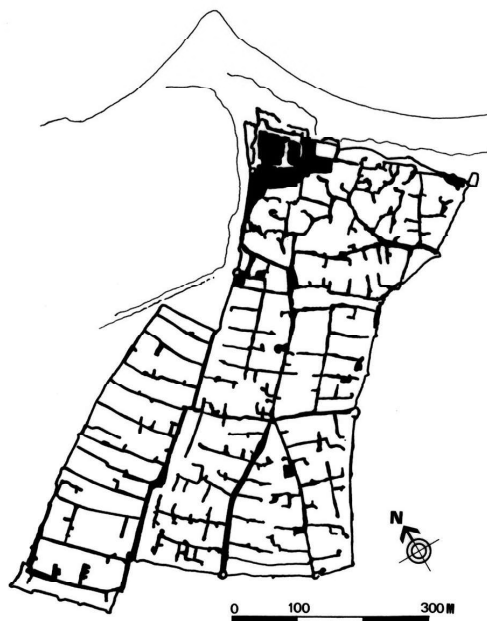
MONASTIR (Túnicia): ciudad islámica perteneciente a la dinastía de los Aghlabitas (800-900 d.C.). Caso de propuesta con un tejido urbano irregular, con las calles principales jerarquizadas desde donde arrancan pasajes ciegos de uso privado. Los Aghlabitas ampliaron y equiparon el ribat , sede de la comunidad de religiosos-guerreros defensores del Islam

banos, que surgían alrededor de las tumbas de guerreros y virtuosos locales. En algunos casos particulares, también se emplazaban extramuros de la ciudad, los grandes conjuntos sepulcrales de soberanos y dignatarios, convirtiéndose éstos en áreas de prestigio y significación especial, como por ejemplo las tumbas de los Mamelucos en El Cairo, de los Timúridas en Samarcanda o los monumentos mogoles en Agra o en Delhi y muchos otros 13 .