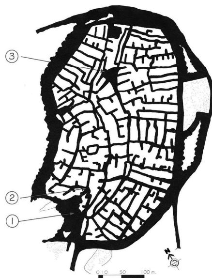
BENI IZGUEN (en berberisco At Isgen ): una de las cinco ciudades islámicas conformantes del sistema territorial denominado la "pentápolis de M'zab" en el área geográfica del Maghreb central (África), durante la ocupación de los Ibaditas (primera mitad del siglo XI). Centro urbano fortificado donde destacan (1) la gran mezquita, con un acceso complejo (2) debido a su extrema sacralidad. El mercado (3) es de forma triangular con plaza porticada y constituye el espacio público para la vida social (Fuente: Florindo Fusaro, 1984: 128).