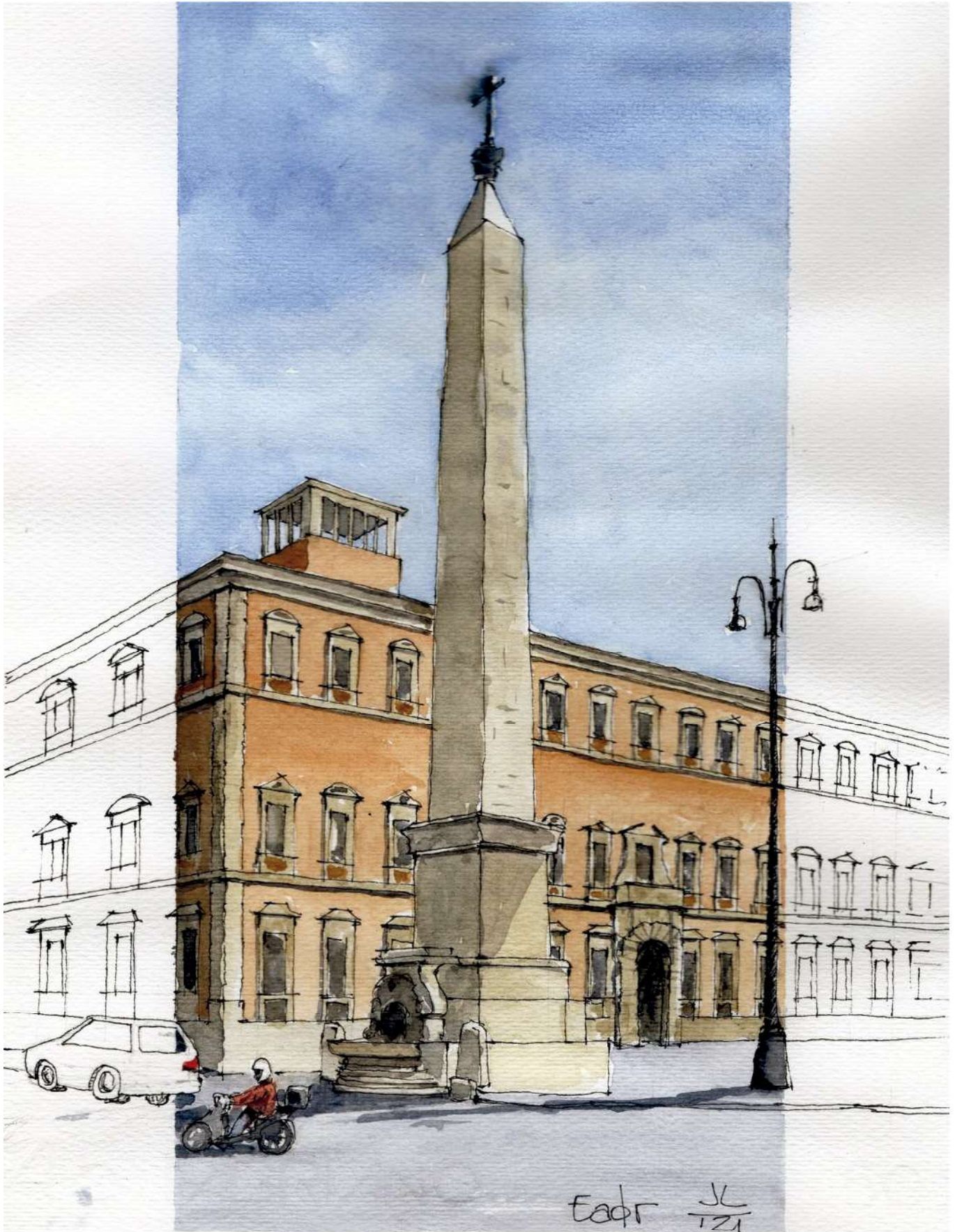
Obelisco San Juan de Letrán Roma. Perspectiva a color. Enrique Adalid Teja. Acuarela y tinta. 2021.