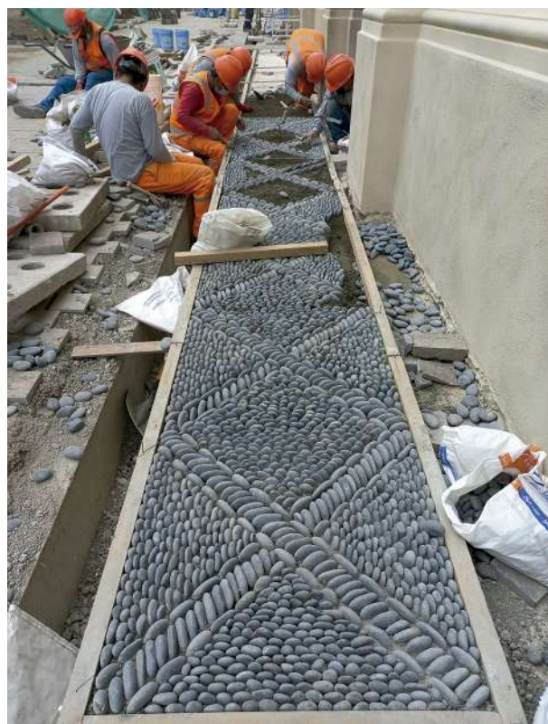
Colocación de nuevos pisos de cantos rodados para las zonas peatonales de la plaza Francia, siguiendo los patrones y las técnicas identificadas durante las labores arqueológicas.