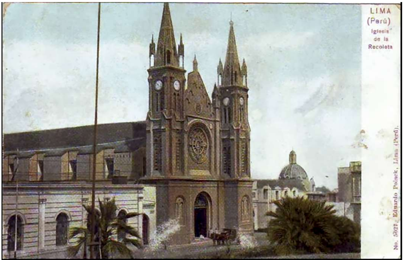
Iglesia de la Recoleta. Lima (Perú). Postal N° 5027. Eduardo Pollack.