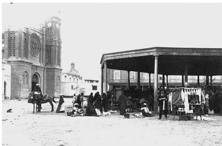
El Mercado de La Recoleta funcionaba los fines de semana bajo una amplia cobertura de madera en medio de la plaza; vista de fines del siglo XIX.