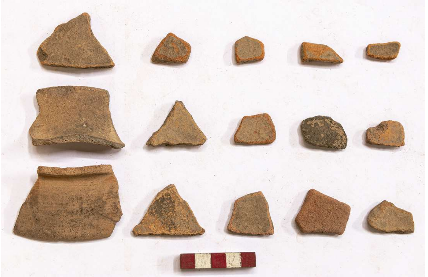
Fragmento de cerámica del periodo "blanco sobre rojo", hallados durante las exploraciones en Plaza Francia.