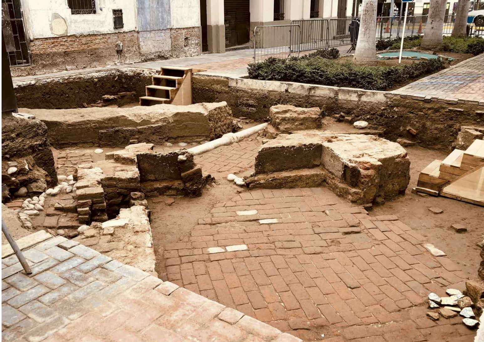
Excavación arqueológica mostrando muros, pisos y la portería del siglo XVII de la Recoleta dominica, bajo el actual pasaje Villarán de la Plaza Francia.