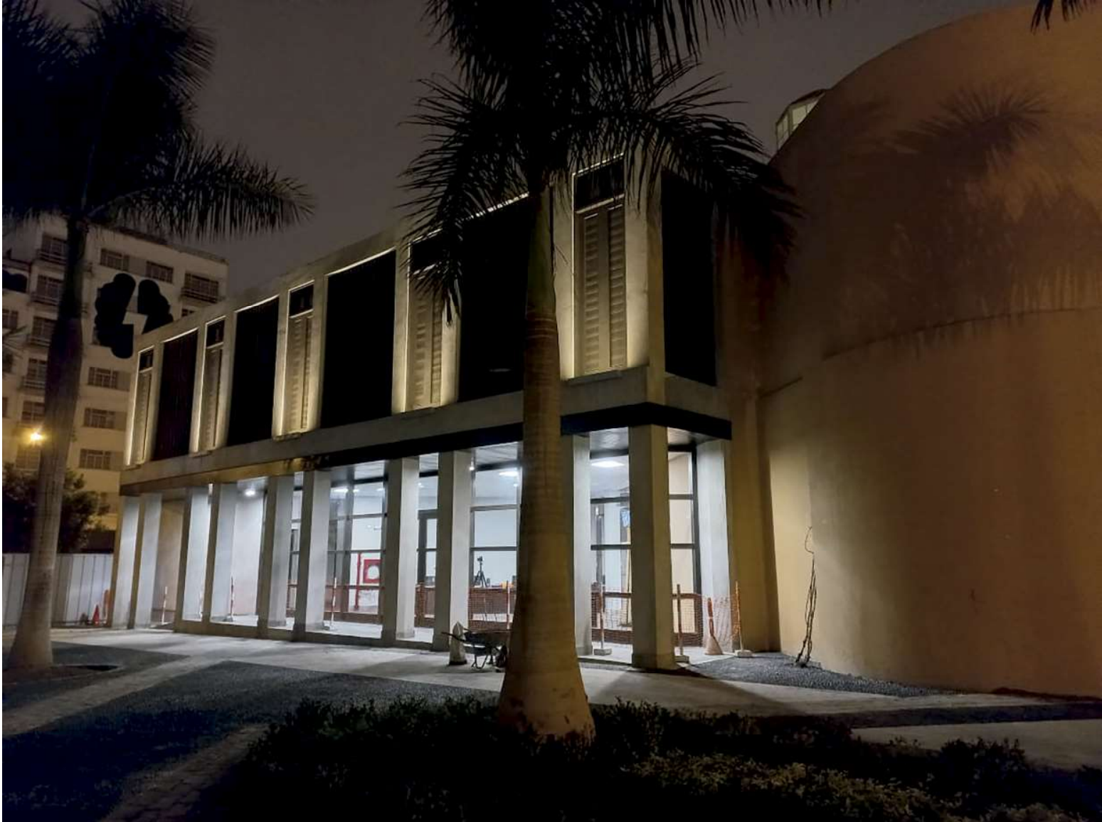
Ingreso al sector moderno del Hospicio Manrique, donde funciona la Oficina de Trámite Documentario, en el pasaje Villarán de la plaza Francia. 2021