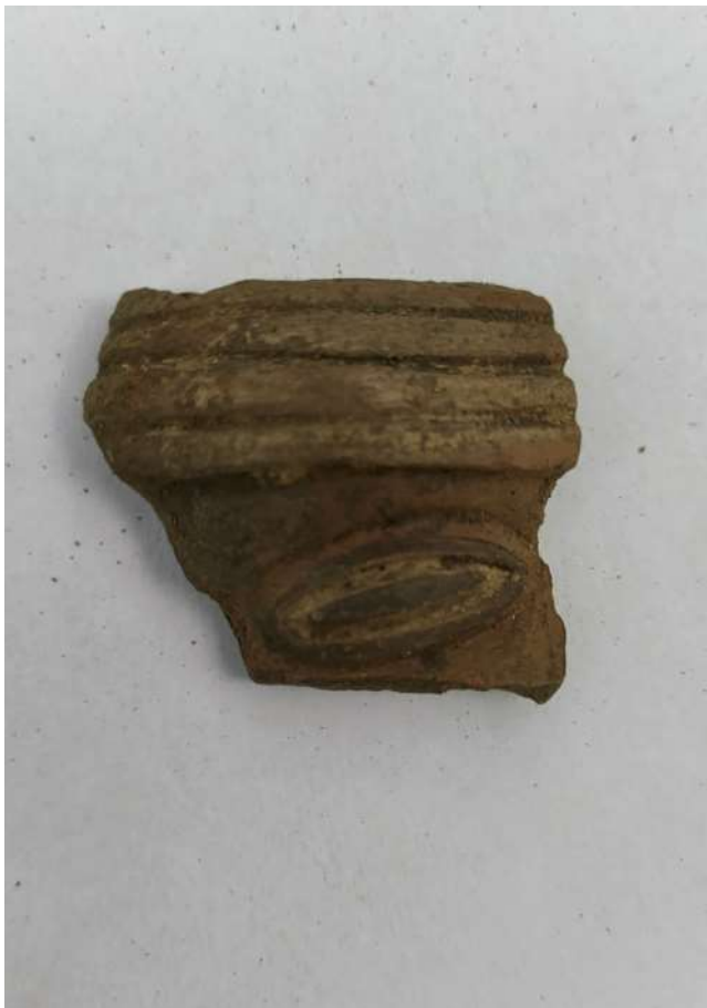
Fragmento de cerámica Yschma hallados durante las exploraciones en plaza Francia. Foto: Miguel Enríquez. Equipo de Arqueología de Lima-PROLIMA. Municipalidad de Lima.