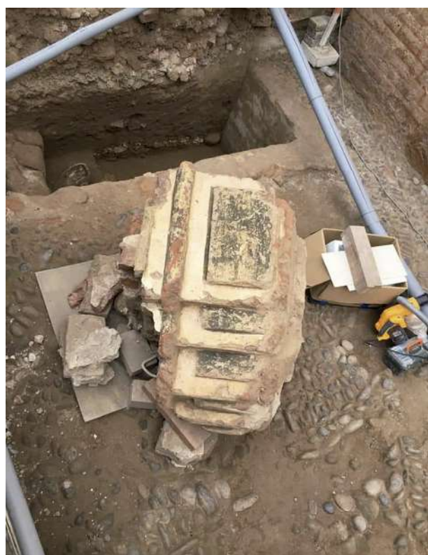
Gran fragmento de mampostería, molduras y pinturas mural del campanario original de la iglesia, caída en 1746, y enterrada luego en el mismo sitio.