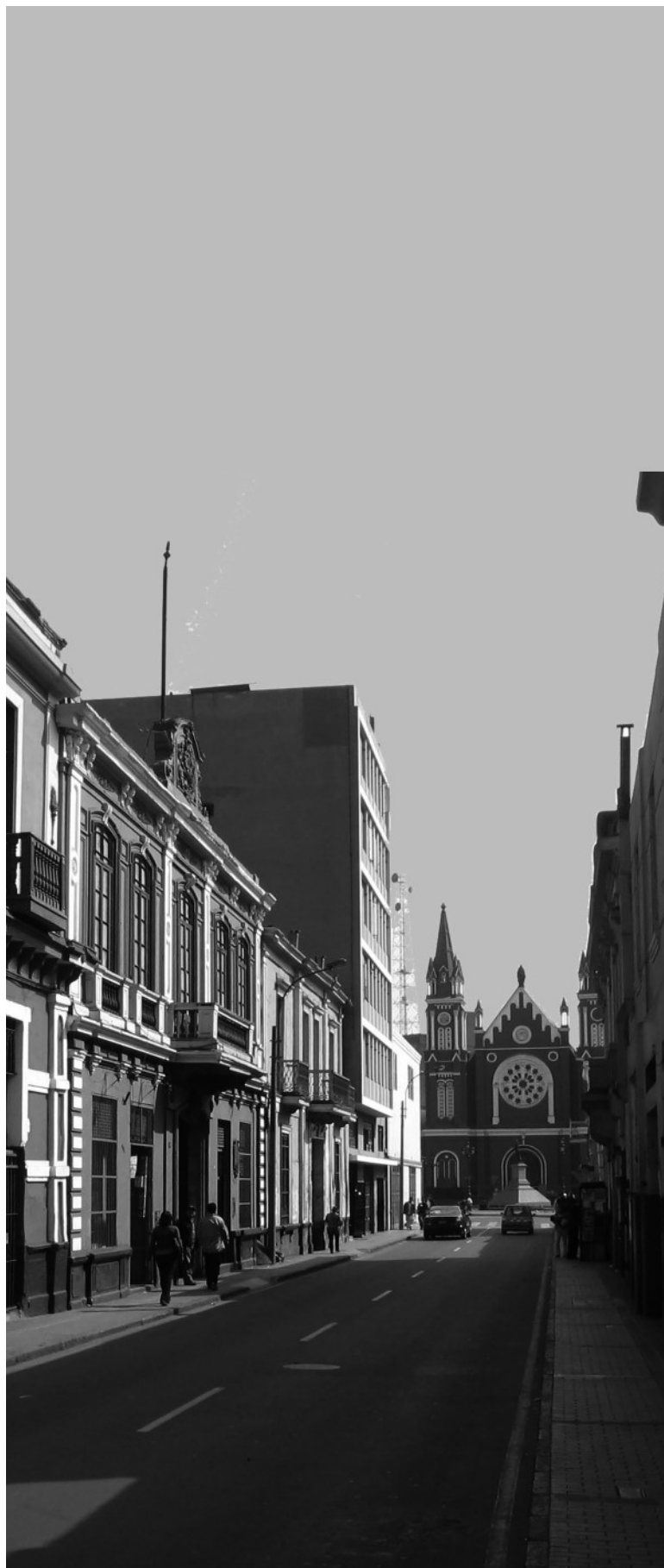
Calle de la Amargura. Vista del Jirón Camaná, hacia la plaza Francia.

(Datos proporcionados por el autor del artículo)