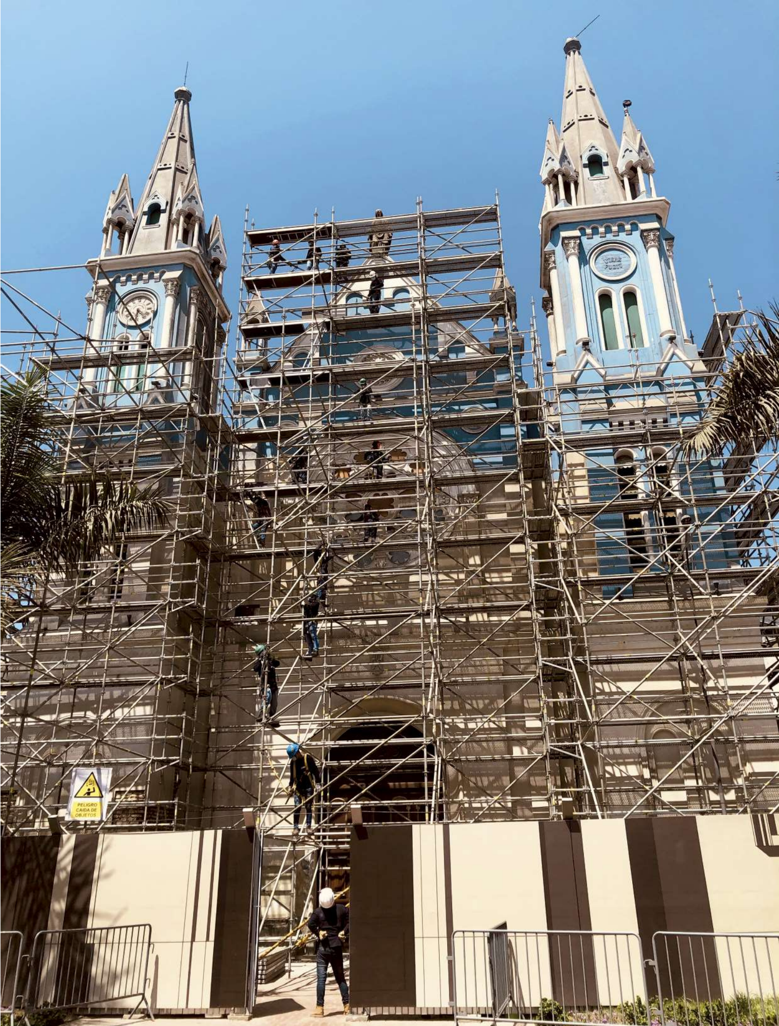
Restauración y decapado general de toda la fachada de la iglesia de La Recoleta, hasta recuperarse su textura original de cuarzo.