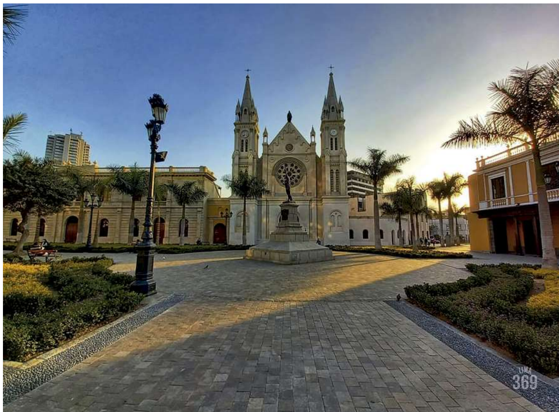
Luces del atardecer sobre la antigua y renovada plaza Francia. Noviembre 2021. Foto: Archivo PROLIMA/Municipalidad de Lima. 2021