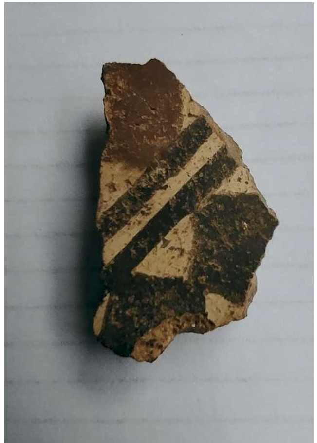
Fragmento de cerámica Inca, hallados durante las exploraciones en Plaza Francia.