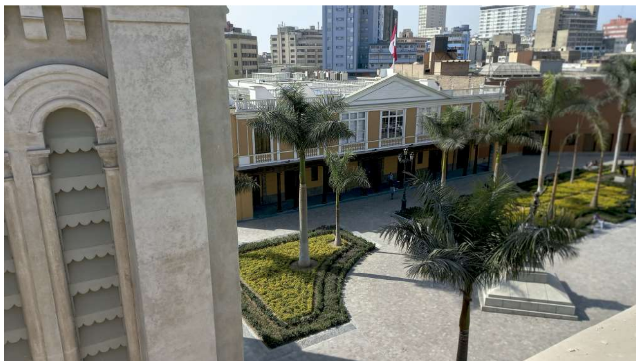
Vista de la torre del campanario de la iglesia y del Hospicio Manrique, completamente restaurados. 2021