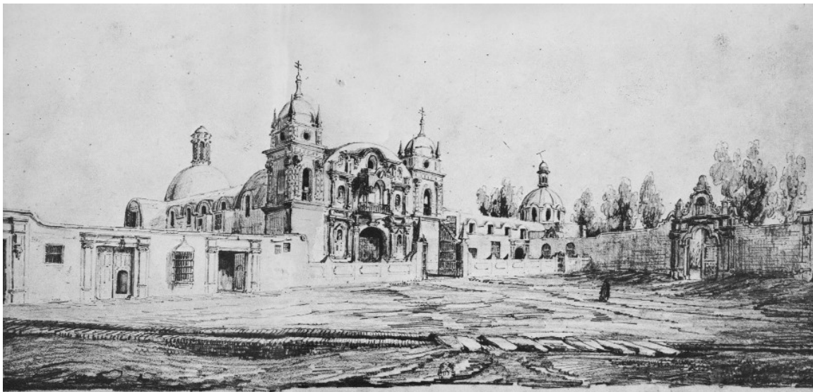
“Estampa del convento de la Recoleta dominica con la iglesia de La Magdalena. A la derecha el huerto del convento”. Dibujo del 29 de mayo de 1847 - Leonce Angrand. En: Imagen del Perú en el siglo XIX, pp. 48-49. Carlos Milla Batres (editor)

del sector. El espacio fue modelado por la intersección de dos vías principales de épocas y orígenes muy distintos: el “callejón de Pachacamac”, de trazado pre-inca, y, un eje importante del trazado del damero español, que actualmente lleva el nombre de jirón Camaná, y que empezaba en la antigua calle de “Pileta de Santo Domingo”, al pie del Convento Dominicano Grande del Rosario, y terminaba en la cuadra de “La Amargura” para encontrar remate en la fachada de la iglesia de la Venturosa.