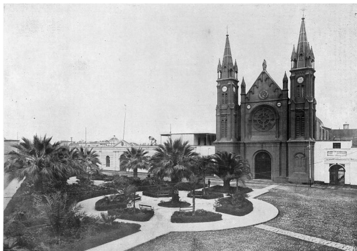
"Iglesia y Plazuela de la Recoleta de Lima"

Poco menos de una década después de la llegada de la congregación francesa, con frente a la misma plaza y sobre el lado izquierdo de la fachada de la iglesia, se construyó el Colegio de los Sagrados Corazones, conocido luego como "La Recoleta", alma mater de numerosos gobernantes y limeños notables. Una notable institución surgida de "La Recoleta" fue la Universi-