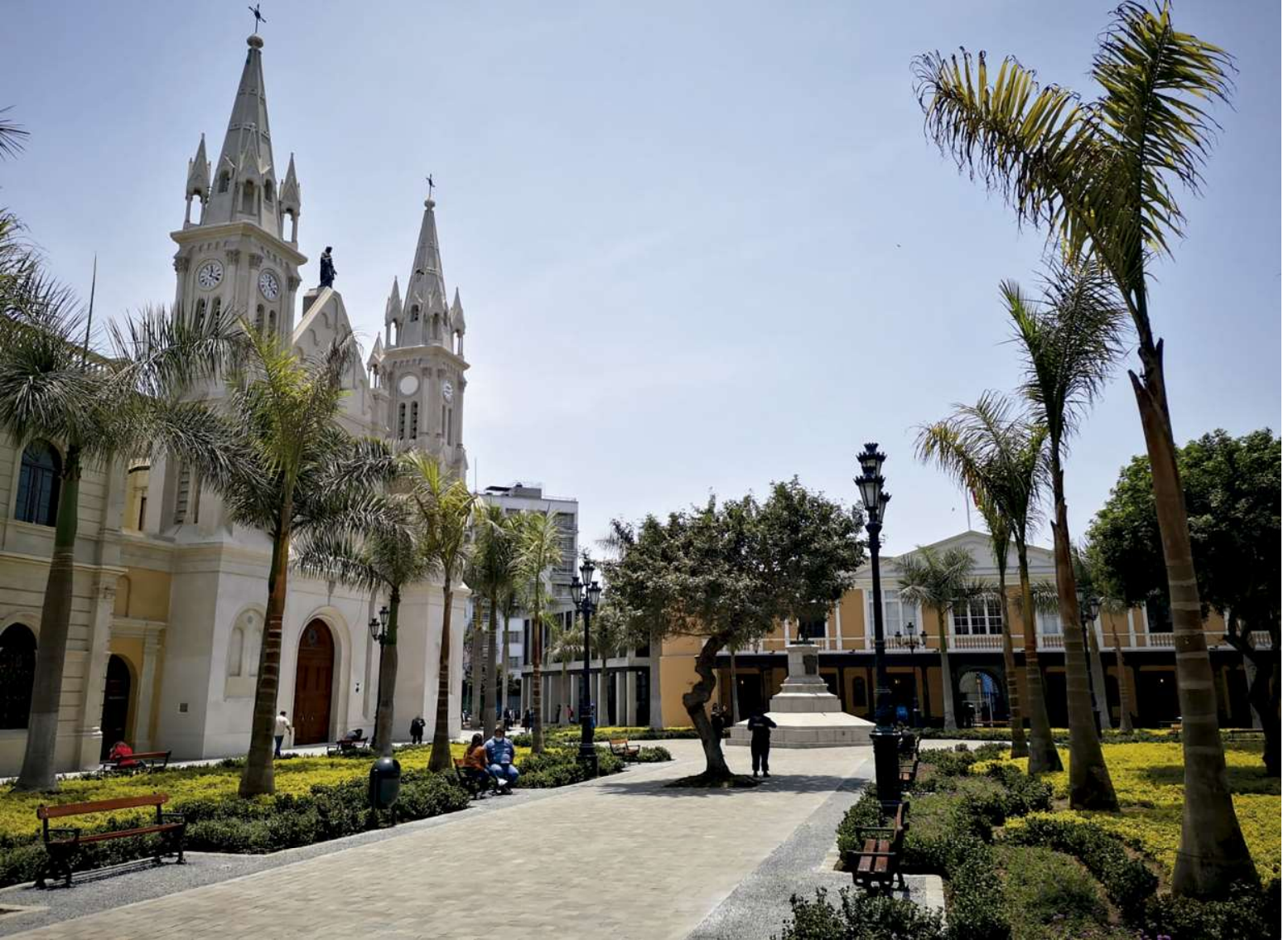
Vista de las restauradas fachadas de la iglesia y Colegio de la Recoleta, sobre las veredas y áreas verdes de la Plaza Francia. 2021