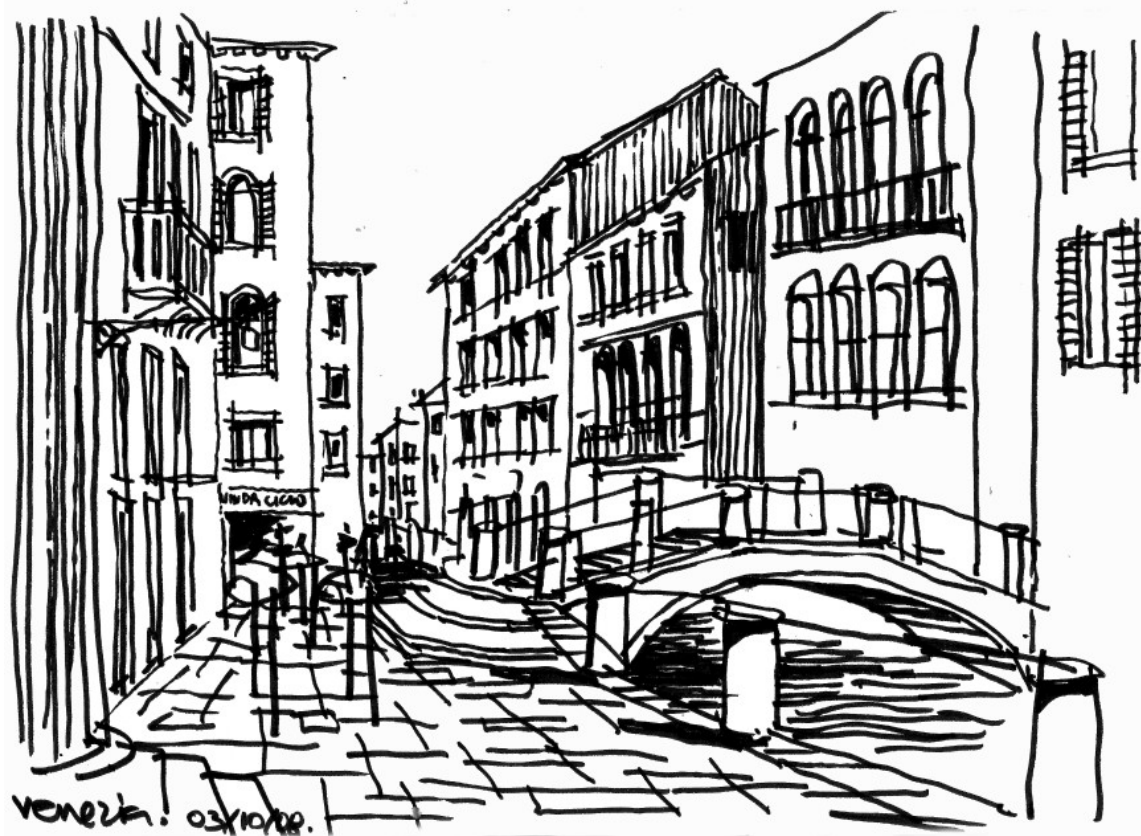
Vistas de Venecia, 2008, Ricardo Flórez Rivas.