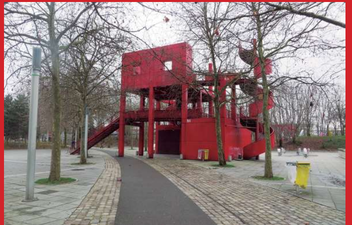
Parque de la Villette, París. Bernard Tschumi. Vistas de la intervención.