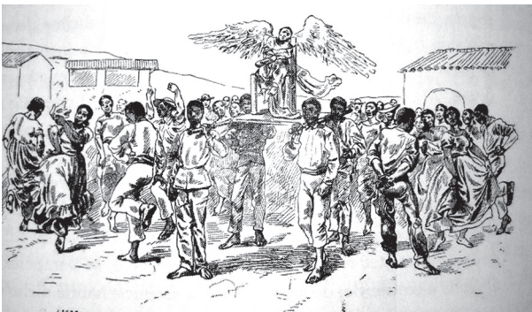
Los funerales a un niño negrito. Trujillo 1876 Wiener, C. (1993). Perú y Bolivia. Relato de un viaje . Lima: IFEA.

Este ritual está compuesto de una procesión, combinada con danzas y festejo. Pues en el imaginario este cadáver de niño aún no ha alcanzado la razón y es por ello que es considerado un angelito por la inocencia que representa la pureza de su corta vida, libre de pecado que ingresaría en forma inmediata al reino de los cielos. Esta forma ritual frecuente en el siglo XIX con el tiempo fue quedando en desuso y solo hasta nuestros días, queda el vestigio de estos relatos, grabados, pinturas y fotografías post mortem que nos muestran ello, pero que en la actualidad solo queda en frases cuando muere un párvulo o un no nato, es común escuchar “ha muerto un angelito”.