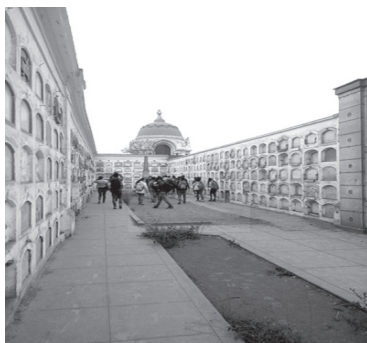
Fotografía del pabellón de Santa Bertha , “Pabellón de los Suicidas” 21/09/2016.

los viajeros, que a través de sus relatos nos ayudan a comprender la importancia de las costumbres y de los espacios públicos como cementerios que resguardan los rezagos de prácticas muy antiguas referidas a la muerte tal como se plasma en el pabellón Santa Bertha, conocido como el pabellón de los Suicidas, ubicado a la altura de la puerta 2 del cementerio Presbítero Matías Maestro.