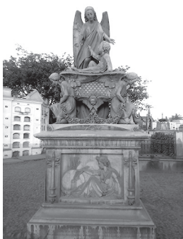
Escultura sobre la tumba: Representación de un niño en pesebre resucitando al llamado de un ángel 13

Estas experiencias reproducen una suerte de vivencia sobre la muerte, que genera una reacción en las personas que van a reproducir la costumbre con fiel convicción sumergiéndola en la cotidianeidad.