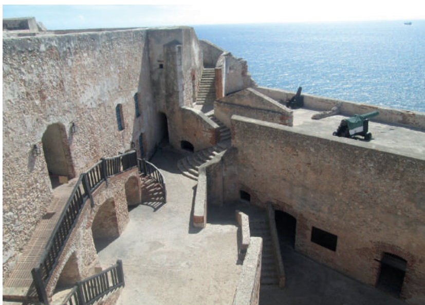
Figura 7. Castillo de San Pedro de la Roca, reconocido como patrimonio de la humanidad.

Los estudiantes adquirieron conocimientos que no están contenidos en sus programas de asignaturas por lo que esta actividad contribuyó a ampliar su espectro cultural con respecto a cómo con el objetivo de defender la ciudad de Santiago de Cuba de ataques de piratas fue construido entre los siglos XVII y XIX. Este junto al Castillo de la Estrella y la batería de Socapa, forma parte del más grande y completo ejemplo de la ingeniería militar renacentista europea aplicada en el Caribe por lo que fue reconocido en 1997 como Patrimonio Universal de la Humanidad (figura 7).