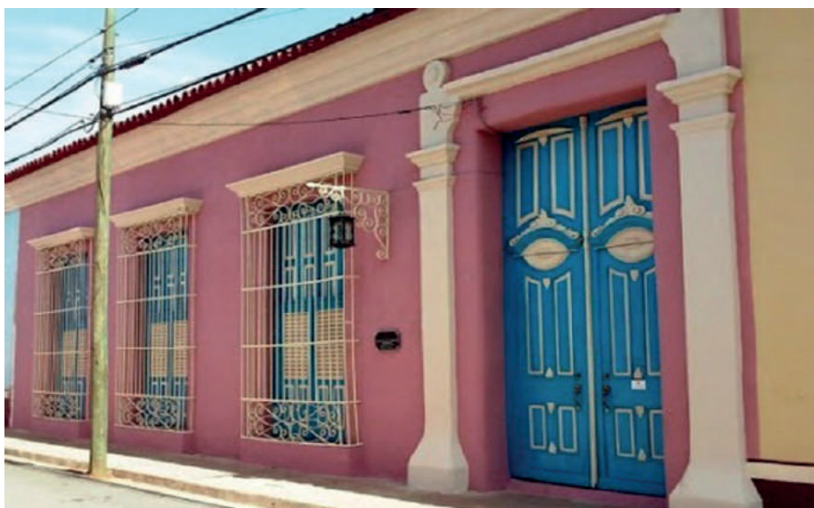
Figura 2. Fachada del Hotel Mascotte, en la ciudad de Remedios.

Particulares intereses mostraron con respecto al museo de Las Parrandas, consideradas éstas Patrimonio