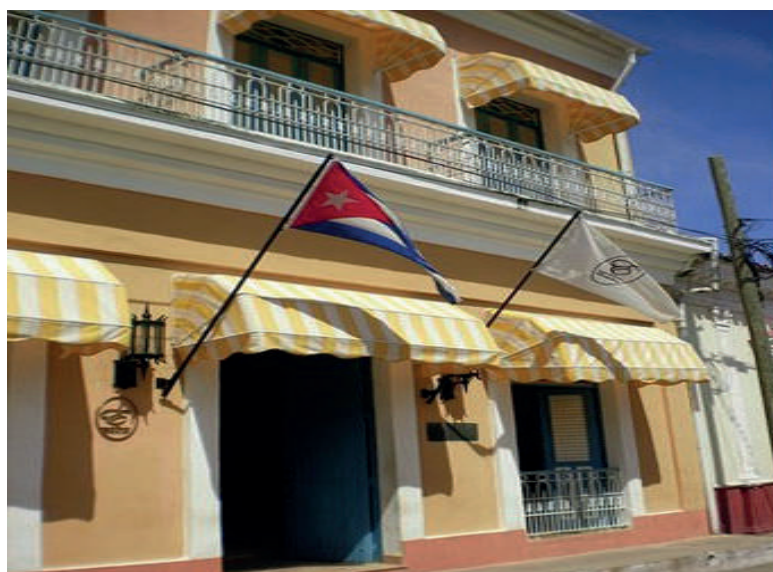
Figura 3. Fachada del museo de las parrandas, muy relacionado con la historia local de Remedios.

Los estudiantes (30) que participaron en la visita expresaron que los habitantes son conscientes de la importancia del rescate de las tradiciones locales para el mantenimiento de la cultura nacional, así como del mantenimiento del casco histórico teniendo en cuenta el cuidado hacia el medio ambiente.