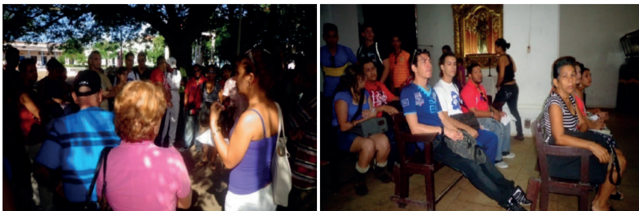
Figura 4. Trabajo de campo en la ciudad Los Remedios con profesores y estudiantes de la carrera.

Se cuenta con anotaciones en los resultados sobre Falla Bonet, aunque no se conoce por los ciudadanos comunes.