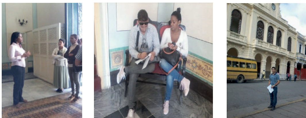
Figura 10. Se observan instantáneas del trabajo de campo realizado en la ciudad de Santa Clara, enclavada en la provincia de Villa Clara, Cuba.