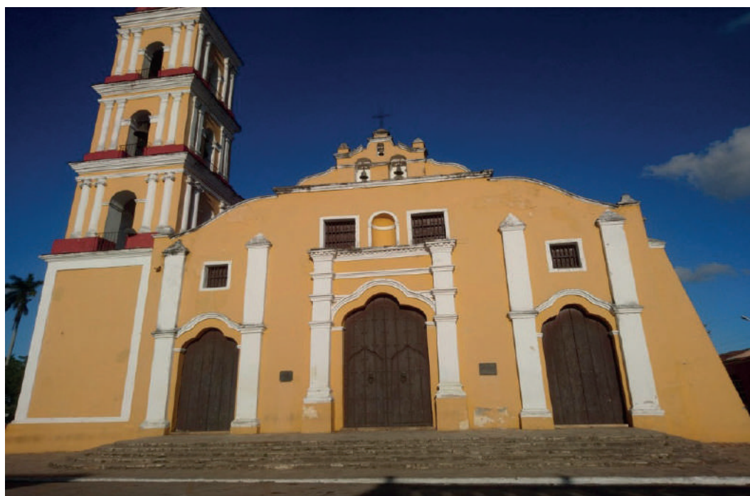
Figura 1. Iglesia de Remedios

Participan 30 estudiantes cuyas respuestas denotan aprehensión con los lugares visitados.