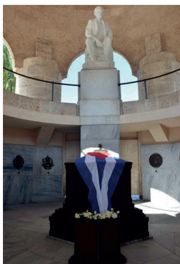
Figura 9. Tumba de “José Martí”. Obsérvese la presencia de la bandera y el ramo de flores perenne en su féretro.