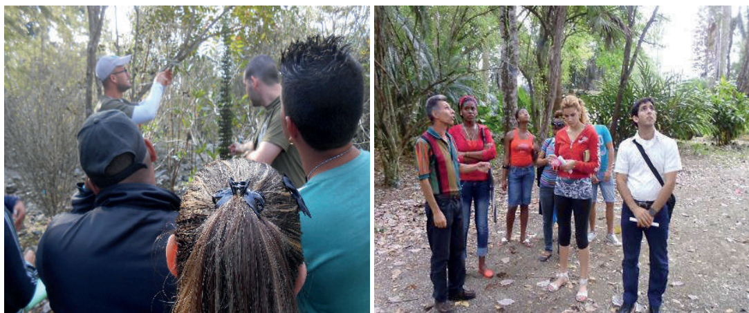
Figura 6. Trabajo de campo en el Jardín Botánico de la Universidad Central "Marta Abreu" de las Villas.

Consideran que, si fueran trabajadores de seguridad del lugar para proteger las plantas y contribuir a la Educación Ambiental de sus visitantes, tomarían medidas acerca de cómo identificar cada una de las plantas con su nombre científico y común y realizar con más frecuencia recorridos de inspección por el mismo y proteger los puntos más vulnerables. La figura 6, presenta fotos de la actividad realizada en el jardín Botánico.