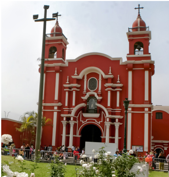
Figura 1. Fachada del Santuario de Santa Rosa.

Los siguientes planos del Santuario de Santa Rosa de Lima nos permitirán apreciar cómo funciona su diseño espacialmente: