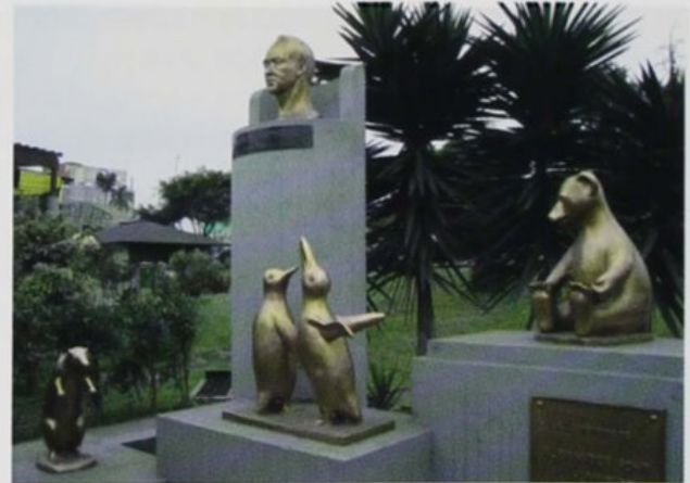
Monumento a Humboldt. Bronce. s. XX. (antes y después). Burda recreación del original. Actual emplazamiento en el Gran Parque de Lima.

¿quién decide lo que es arte hoy?: las bienales, los museos, las galerías, las revistas y sus críticos. La modernidad, considerada como una fuerza irrefrenable en continuo cambio, que ha puesto sus ideales en la novedad y la moda, nos ha acostumbrado a esta práctica; una fuerza que sigue también los dictados del mercado, ya que en la sociedad de consumo, el arte, aunque suene chocante, es una mercancía más.