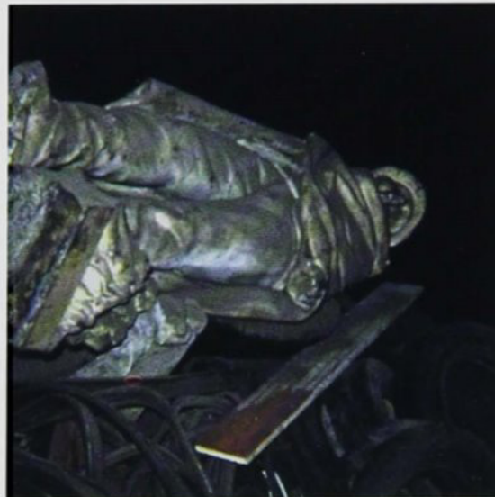
Escultura de El invierno . Mármol s. XIX. Anónimo. (antes y después). Foto de la escultura tal como se encontraba en un depósito de la Municipalidad de Lima, que hasta el momento no la han restaurado y devuelto a su lugar de origen.

la belleza de un monumento o la pertinencia del diseño urbano de su ciudad. El error de los alcaldes provinciales consiste en considerar los parques y las plazas como si fueran la sala de su casa familiar, como bien ha dicho el Arquitecto Wiley Ludeña en un esclarecedor artícu-