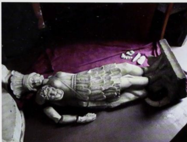
Escultura de América tal como se encuentra el día de hoy en la casa de la Sra. Alvarado, vecina de El Cercado. Foto: A. Castrillón, 2009.

Por otro lado, los alcaldes de Lima no han sido muy buenos guardianes del patrimonio escultórico de su ciudad: ¿Cuántas esculturas han desaparecido entre gallos y media noche? Las del monumento a Humboldt en el Parque de la Reserva; El Invierno , que representaba a un anciano bien abrigado, con sombrero y fumando una pipa, formaba parte de "Las cuatro estaciones" del Paseo Colón. Hace muchos años un ómnibus de servicio público se la llevó de encuentro y la fraccionó; la Municipalidad la recluyó en uno de sus depósitos y hasta el día de hoy no se ha restaurado. El niño de las canicas de Ismael Pozo Velit; la representación de América en la plaza del Cercado, Barrios Altos. 10 ¿Cuántos monumentos han sido objeto de cambios caprichosos? El ejemplo más conocido es el de Pizarro que desde el atrio de la catedral pasó a la placita de la calle Palacio y de ahí al Parque de la Muralla, sin pedestal y sin los relieves laterales hechos por Piqueras Cotoquí. Otra escultura que ha incomodado a los alcaldes de Miraflores ha sido Hacia la gloria de Lajos D'Ebneth, que representa