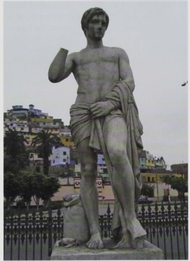
Cáncer, 1855. Andrea di Carrara. Mármol. Alameda de los Descalzos.

a un hombre desnudo levantando los brazos hacia el cielo. Inicialmente fue colocada en el Parque de Miraflores, retirada de este lugar por considerarla indecorosa, ubicada luego en la entrada de la Galería de Arte de la Municipalidad y por fin puesta en el Parque Salazar. ¿Cuántas esculturas han sufrido por acción del vandalismo? Basta darse un paseo por la Alameda de los Descalzos y ver como los vándalos han acometido contra la serie de doce estatuas que componen el famoso Zodíaco, rompiéndoles las extremidades y llenándolas de graffiti . Se ve que a la Alcaldía del Rímac no le interesa cuidar el conjunto escultórico más importante que tenemos y que podría convertirse en un núcleo cultural propicio para festivales, ferias, teatro, conciertos, exposiciones al aire libre, etc.