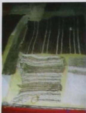
Sala Arqueología: Fragmentos textiles en mal estado de conservación y presentación

prolongada a la luz natural y montaje inadecuado.