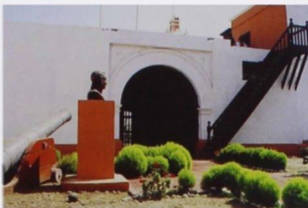
Patio de ingreso

presencia de humedad, rajaduras en los muros, inseguridad de las cubiertas, instalaciones sanitarias y eléctricas deficientes y principalmente la carencia de servicios básicos para su funcionamiento como espacio público.