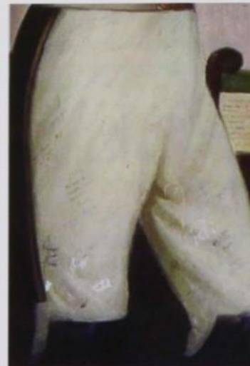
Detalle de graffiti