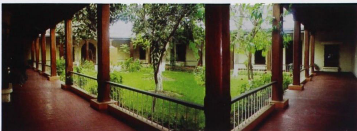
Jardín interior donde se ubican las Salas Batallón Numancia y Sala Legión Peruana