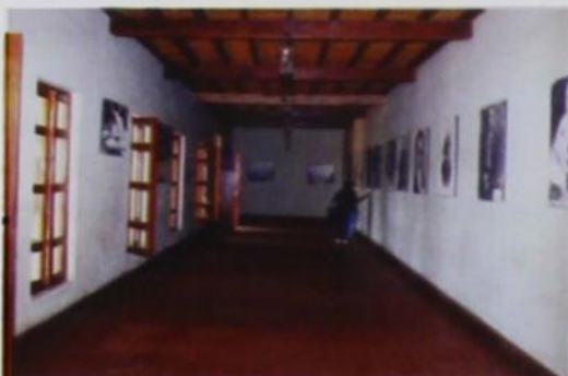
Sala Legión Peruana

- Sala de la Legión Peruana y Batallón Numancia: En ambas salas se muestran fotomurales en blanco y negro de personajes que participaron en la gesta libertadora.