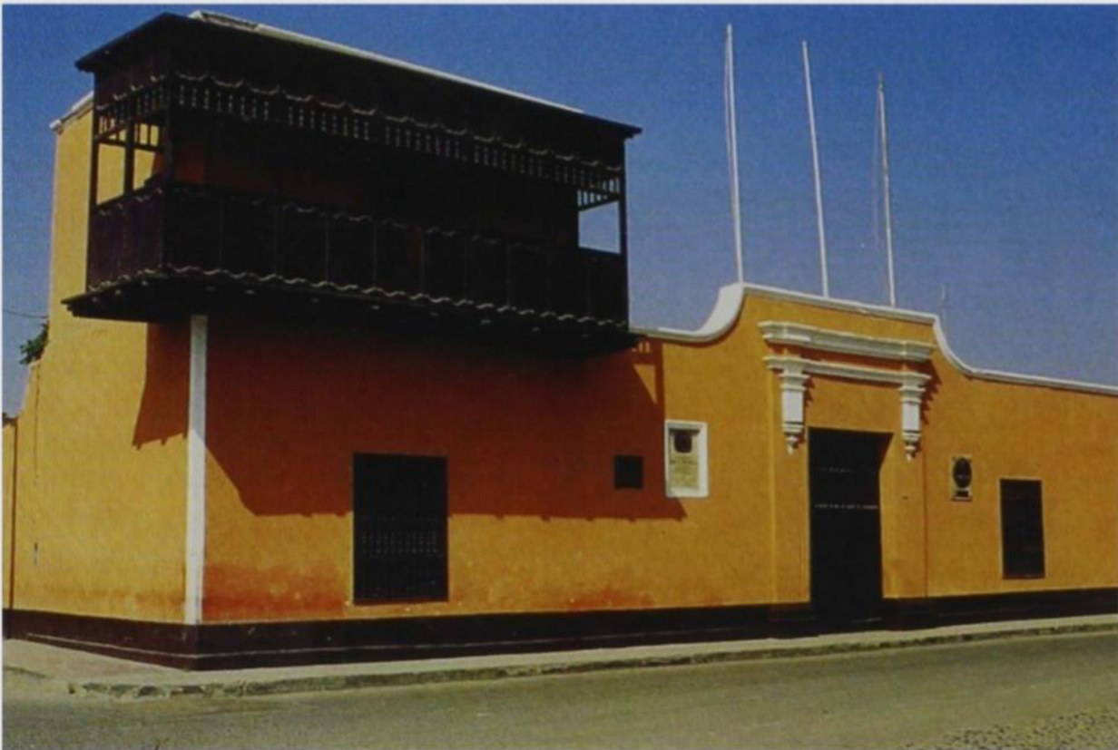
Fachada del Museo Monumental de Huaura ubicado en la Av. San Martín S/N, Distrito de Huaura

El inmueble donde se ubica el Museo Monumental de Huaura 1 , encierra una historia que data desde tiempos de la Colonia 2 y que a lo largo de la vida republicana ha sufrido transformaciones en su estructura y funciones. En su fachada se aprecia el orgullo de la localidad que es su antiguo balcón de madera desde el cual -según la tradición- el General José de San Martín proclamó la independencia nacional en 1820.