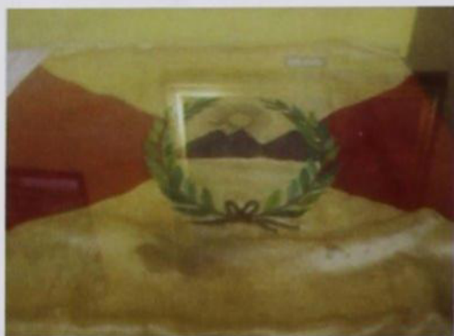
Bandera peruana de seda en mal estado de conservación

presenta graffitis ocasionados por estudiantes que por falta de vigilancia no han tenido respeto por las obras. Del pintor Raúl Vizcarra el Desembarco en la Bahía de Paracas de 1973, La Proclamación de la Independencia y una vitrina con un maniquí con la réplica del traje de un Granadero donado por Argentina.