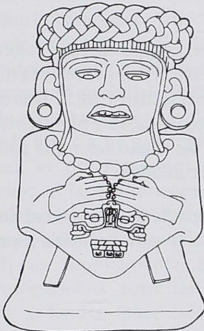
Figura 3. Diosa 13 Serpiente. Cerámica zapoteca. Dibujo de Adam Sellen.