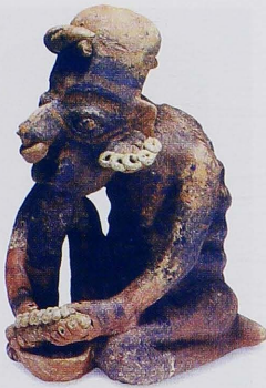
Figura 1. Anciana desgranando maíz. Cerámica de Nayarit, Cultura del Occidente.