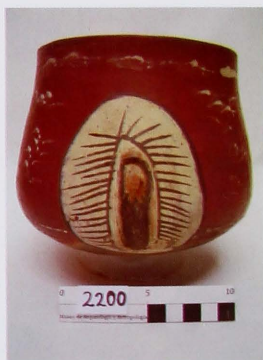
Figura 6. Taza nasca. Museo de Arqueología y Antropología de la Universidad Nacional Mayor de San Marcos.