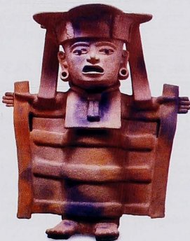
Figura 4. Sacerdotisa. Cerámica de Remojadas, Veracruz.