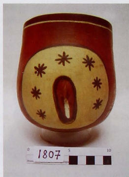
Figura 7. Taza nasca. Museo de Arqueología y Antropología de la Universidad Nacional Mayor de San Marcos.

pintura permite contrastar la zona genital del resto del cuerpo -apenas sugerido- remarcando además los labios y el vello púbico. En un caso el vello es realista (fig.6), en el otro se distinguen formas estrelladas que podrían ser tatuajes (fig.7). Una de las tazas está “decorada” además con un pintarrajeado blanco, probable representación del líquido fecundante masculino. Estas piezas evidencian el alto valor que para los nasca tuvieron conceptos como sexualidad, dualidad y fecundidad.