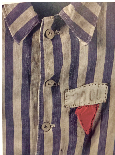
Camisa de recluso (1940-1944)