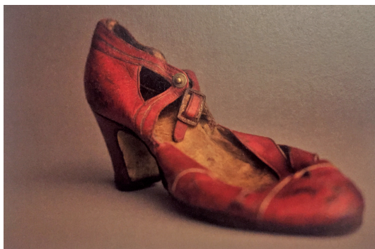
Zapato de vestir perteneciente a una deportada anónima. Colección del Museo Estatal de Auschwitz-Birkenau