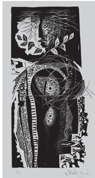
Alberto Ramos. Autoretrato . Xilografía. 10 x 20 cm, 2018

Alberto Ramos Palacios nació en Nasca, Ica, en 1953. Realizó estudios de Pintura, Dibujo y Grabado en la Escuela Nacional de Bellas Artes del Perú entre los años 1976 y 1991. Obtuvo