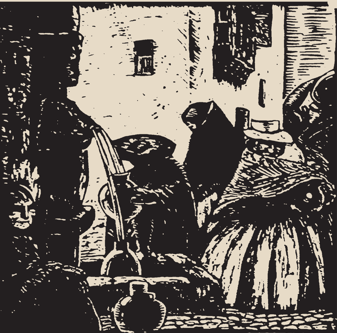
Fuente de Arones. José Sabogal, grabado. 1925. Esta "Mama" buena verdinegra y brillante adosada al muro ofreciendo eternamente sus senos a los sedientos y coronada por el Sol.