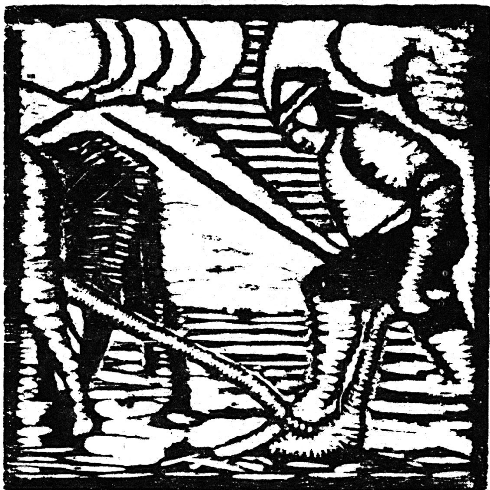
Detalle de la carátula de la Revista CUNAN N° 3, por Manuel Domingo Pantigoso.