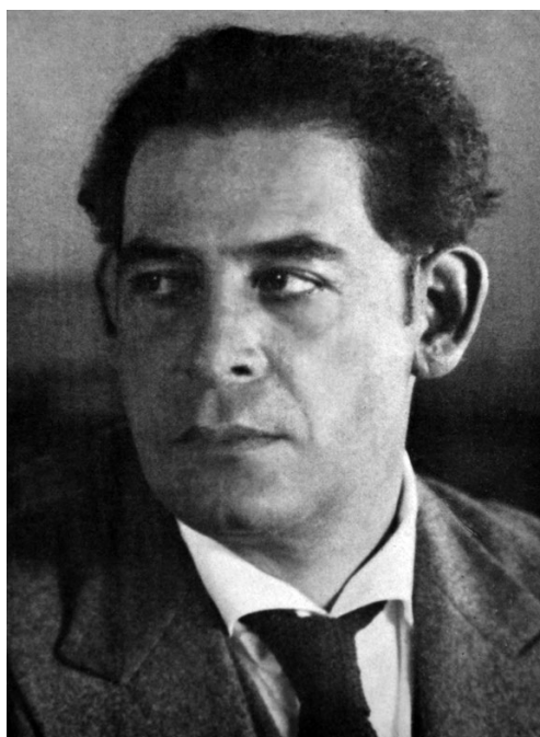
Fig.3. José Sabogal.

Las cartas de modo general evidencian el temperamento vigoroso, a ratos vertical e intransigente del gran orientador del Indigenismo. También demuestra la cercana amistad con quien era el abanderado del Ultraorbicismo pictórico (Indigenismo de Vanguardia, surgido desde Puno), más abierto y democrático en su línea de pensamiento. Eran, sin duda, de temperamentos diferentes, y aunque estéticamente tenían también diferencias que el tiempo las fue acentuando, nunca se resquebrajaría esa aproximación amical y de respeto que había entre ellos, incluso en los más álgidos momentos cuando el Indigenismo y la Escuela de Bellas Artes, motivados por cierta impronta socializante, tuvo múltiples detractores. Mercedes Gallagher de Parks criticaba esa inclinación que existía entonces: “Hacer arte doctrinario –decía– es simple y llanamente matar el germen creador” 9 . A