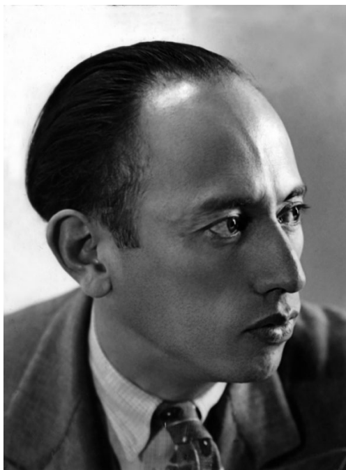
Fig.4. Manuel Domingo Pantigoso.

verdadero destino. Alberto Tauro del Pino diría al respecto en una conferencia de 1991 ofrecida con motivo del fallecimiento del pintor arequipeño, acaecido 35 años después de la desaparición del artista cajamarquino: “Pantigoso y Sabogal son diferentes pero ambos descubren el alma y la raíz del Perú para definir su personalidad”.