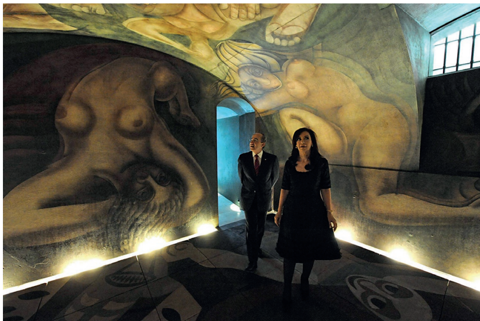
Fig.1. Interior de la cava en la que se encuentra el mural. Fotografía: Diario La Nación . Argentina, 3 de diciembre del 2010.

mecánica, en vez de brocha manual de palo y pelo” (Schávelzon, 2009), como materiales usó el “silicato de etilo, de uso industrial, por su alta resistencia y su protección contra la humedad” y el “proyector de negativos de vidrio” (Schávelzon, 2011:7) para deformar intencionalmente los cuerpos, algo imposible de conseguir con modelos vivos (Schávelzon, 2011:8). Antes de partir de Buenos Aires, a fines de 1933, publicó a nombre de todo el grupo un folleto en el que trataba de justificarse y darle sentido al mural: “La base de eso estaba en el trabajo socializado y en que siguiendo las ideas del cineasta Sergei Eisenstein, lo había hecho para ser filmado y luego proyectado a las masas, lo que justificaba su carácter cerrado. Que en realidad no era un mural pintado a satisfacción de un comitente privado sino un ejercicio para el cine revolucionario” (Schávelzon, 2011:8).