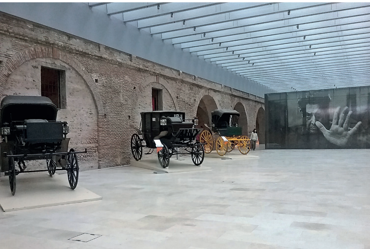
Fig.2. Explanada del museo.

Ciertamente, el Mural poco tiene que ver con la temática del museo salvo que se busque una interpretación forzada que conecte el espíritu revolucionario de Siqueiros con el sentido revolucionario que pretendía imprimirle el kirchnerismo a su gobierno. Sin embargo, creo que una mirada menos parcializada podría encontrar no sólo valor patrimonial en la pieza, sino que ésta tiene relación con la temática del museo en tanto que es un símbolo de la resiliencia, ha resistido a su destrucción, como lo ha hecho el pueblo argentino a través de la historia. Por otro lado, Ejercicio Plástico es conocido como la única obra no política de Siqueiros, aunque es en sí una revolución en el campo del arte, fue motivado por el apasionamiento entre el artista por su mujer, Blanca Luz Brum 2 : “La obra, al quedar libre de ataduras formales del Realismo Socialista, se transformó en un canto lírico a su mujer que se separaba de él, en una construcción casi teatral, en una secuencia semi-onírica de una belleza enorme, posiblemente porque desató la capacidad creativa de todo el grupo de artistas” (Schávelzon, 2011:6).