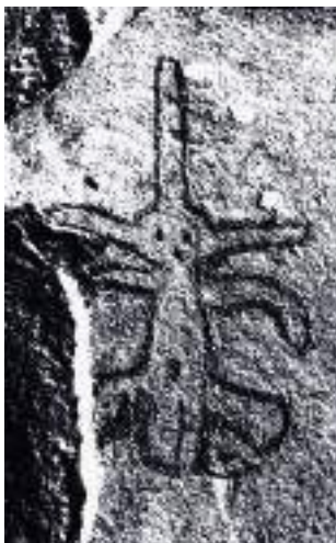
Figura 18. Calco digital realizado por A. Ocampo.

El curioso petroglifo, que denominamos "Personaje diadema", es eminentemente simétrico y tiene una altura aproximada de cincuenta centímetros. 12 (Figs. 17 y 18). No distinguimos manos al inicio de sus flexibles extremidades superiores y, por lo tanto, no lleva asido ningún tipo de elemento. Destaca por los tres puntos que configuran su rostro –ojos y boca–; por la forma de su cabeza, de la cual tres cintas o lengüetas se alargan culminando en puntas romas, y también por el punto que señala su ombligo.