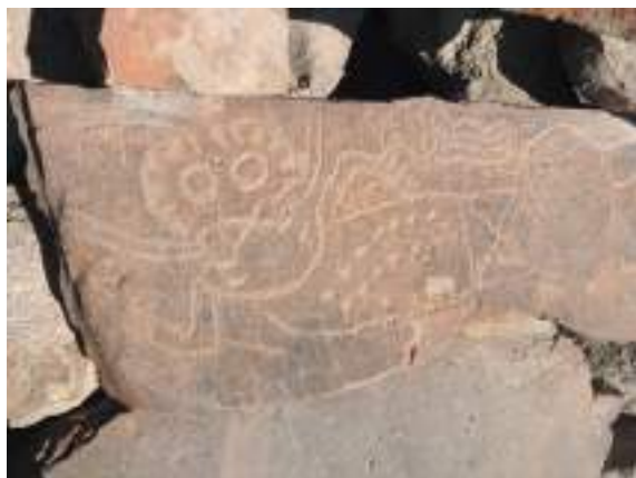
Figura 6. "Ser volador". Petroglifo en Chichictara.