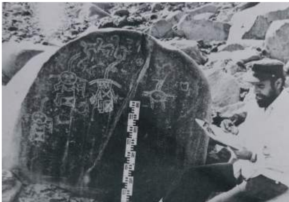
Figura 14. Panel con “personajes sentados”. “La Viuda”, Palpa. (Tomado de A. Núñez Jiménez.).

célebre de todos los paneles pétreos de Palpa, ubicado en “La Viuda”, a pocos kilómetros de Chichictara y, por lo tanto, perteneciente a la misma tradición rupestre. En ese panel destacan tres personajes que empuñan cetros y están sentados de perfil, dos de los cuales exhiben dos piernas y el tercero, tres (Fig. 14) (Vemos también que se interrumpió el trazado de un cuarto personaje del cual solo queda el bosquejo de la cabeza –con los infaltables tres filamentos– y el torso). Pero si hemos recurrido a este conjunto es por otra razón: cada uno de los personajes está sentado sobre un banco que lleva inscrito una especie de “reloj de arena” y que nos hacen pensar en las aspas de los asientos en Chichictara. ¿Estas aspas son la síntesis gráfica de aquellos?