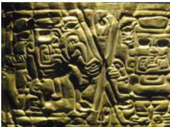
Figura 4. Corona de oro Chavín. Museo Larco, Lima.

La incursión en el ALG nos dejó entusiasmados por la perspectiva de hallar en otros paisajes rupestres del Perú muchos de los diseños que habíamos visto en las vitrinas de los museos y en los libros de arqueología, tal como nos pasó allí. Tiempo después comprendimos que esa recurrencia iconográfica no se producía tan frecuentemente como pensábamos.