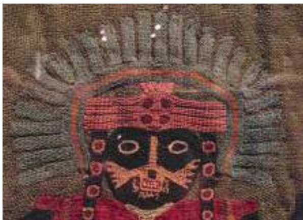
Figura 19. Personaje bordado con “doble diadema”. Manto Paracas.

Tampoco estamos seguros de cómo estos pictogramas, petroglifos y geoglifos, fueron modificándose durante los rituales que las poblaciones colindantes y los posibles peregrinos