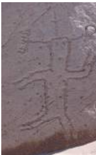
Figura 16. Personaje en panel en "Toro Muerto", Castilla, Arequipa.

representen solamente plumas en el caso de las figuras de Palpa.