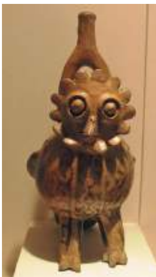
Figura 9. Ceramio ornitomorfo Salinar. Museo Larco, Lima.

El personaje grabado que nos parece la representación de una criatura del aire, ya que no presenta extremidades inferiores, ocupa casi la totalidad del panel pétreo que hoy se halla sobre el suelo. El penacho o tocado segmentado, los grandes ojos circulares y el aspa situada en el lugar donde debería estar la boca –semejante a la que cruza la parte correspondiente a su vientre o regazo, lo que nos hizo descartar que se tratara de un intento audaz, y poco logrado, de plasmar un escorzo del pico–, así como la doble hilera de “motas”, resueltas por sustracción, que recorren su abdomen, lo emparentan a la vez con el plumaje de algunas aves. 9