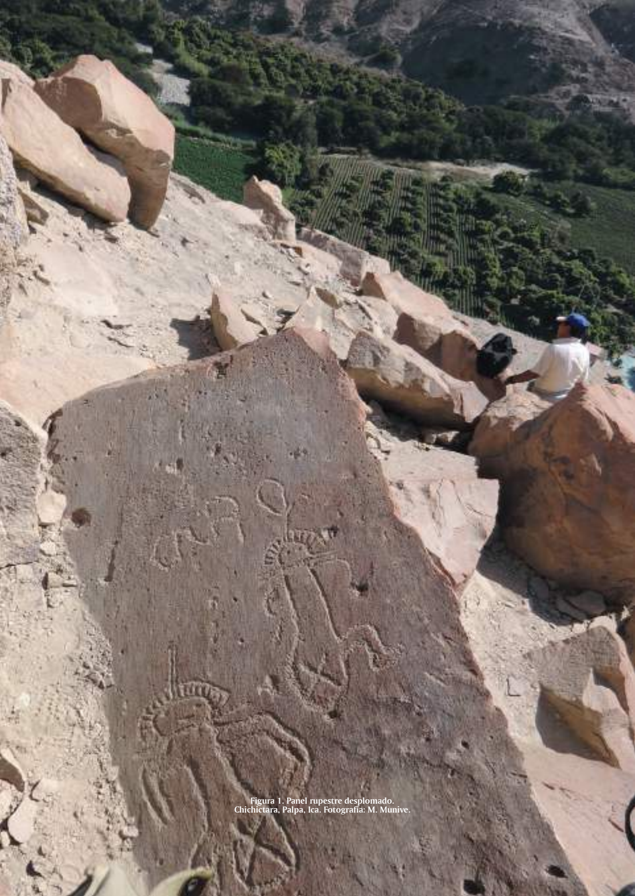
Figura 1. Panel rupestre desplomado. Chichictara, Palpa, Ica.