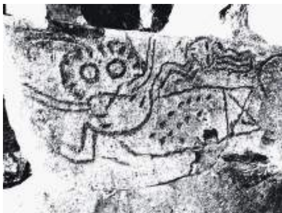
Figura 7. Calco digital realizado por Andrea Ocampo.