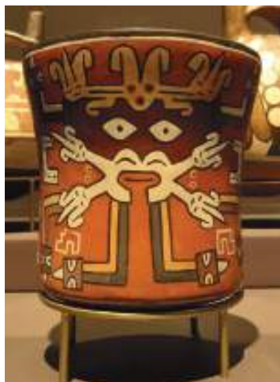
Figura 20. Rostro de personaje mítico con diadema en cerámico Nasca.