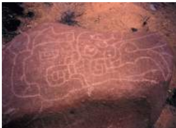
Figura 2. "Piedra de los tres rostros". "Alto de las Guitarras", Laredo, La Libertad.