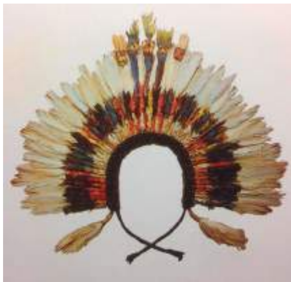
Figura 12. Penacho Nasca confeccionado con lana y plumas de guacamayo. (Tomado del libro "Arte y tesoros del Perú. Nazca". (Lima, 1986).