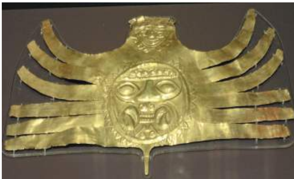
Figura 21. Diadema de oro Nasca.

debieron realizar a lo largo del tiempo, así como tampoco podemos saber –como si hiciera falta sumar más incertidumbres– en qué medida la incesante transformación tectónica ha desplazado, volcado y alterado las rocas que son su soporte primordial.