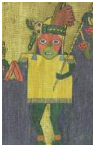
Figura 15. Personaje femenino. Manto blanco . Museo de Arqueología de la UNMSM.