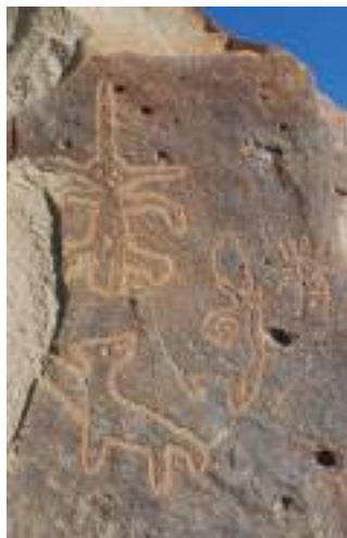
Figura 17. "Personaje diadema". Chichictara, Palpa, Ica.

Analizaremos el segundo de los petroglifos de Palpa de forma aislada, debido a que el panel donde está plasmado ha sufrido el desprendimiento de un área importante de su superficie. No incluiremos, por lo tanto, ni la figura del cuadrúpedo que dirige la mirada hacia arriba ni los grabados lineales y abstrusos con quienes comparte el lado izquierdo del soporte pétreo.