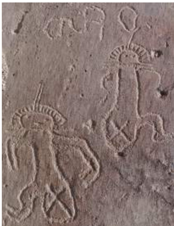
Figura 13. Personajes. Panel desplomado de Chichictara.

que conforman una dupla a nivel simbólico: se hallan dispuestos en simetría diagonal y se complementan, al punto de que cada uno exhibe la pierna que no se ve en el otro. Llevan también tocados o penachos, comparten unas prolongaciones filiformes que se proyectan desde sus cabezas y cuellos y, como es recurrente en la iconografía de esta región, aparecen sobre unos raros asientos que, en este caso singular, contienen un aspa.