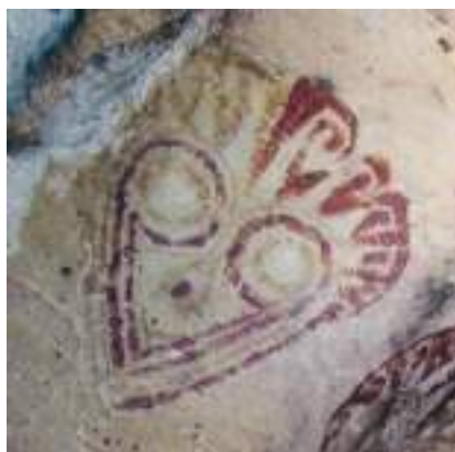
Figura 11. Pictografía. Cueva de Mataral, Bolivia. (Tomado de R. Querejazu).

Dos ceramios escultóricos del Museo Larco, que representan aves de grandes ojos, uno salinar y otro moche, aportaron pistas sugerentes (Figs. 9 y 10). La primera de las aves tiene trece protuberancias que orlan su rostro circular y la segunda tiene decenas de motas por todo el cuerpo. Finalmente, una pictografía “mascariforme” 10 de la Cueva de Mataral, en Santa Cruz de la Sierra (Bolivia), contribuyó a completar esta interpretación descriptiva del petrograbado (Fig. 11). ¿Se trata de un ser mitológico con rostro de lechuza, que cercena cabezas humanas, y que antecedería la configuración del llamado “Ser mítico antropomorfo en captura de cabezas” identificado en uno de los extraordinarios cuencos de doble cuerpo excavados en Cahuachi hacia fines de la primera década de este siglo?