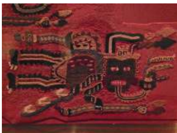
Figura 8. Personaje bordado en manto Paracas.

El primero de ellos es visiblemente paracas: representa un ser volador, con rostro de ave (¿un búho?), que porta una cabeza humana cortada en una mano, cuyas características y planteamiento estructural es semejante al de los personajes bordados en los mantos de ese periodo. El segundo, que parece posterior al "ser volador", por la fluida resolución de su contorno, es básicamente un motivo antropomorfo de cuya cabeza salen, simétricamente, prolongaciones filiformes, en las cuales nos parece reconocer los primeros vestigios formales de lo que más adelante se convertirá en las diademas —y narigueras— mitificadas o animadas con ojos y bocas de paracas y nasca. En todo caso, creemos que concentra la esencia del diseño de esos objetos suntuarios.