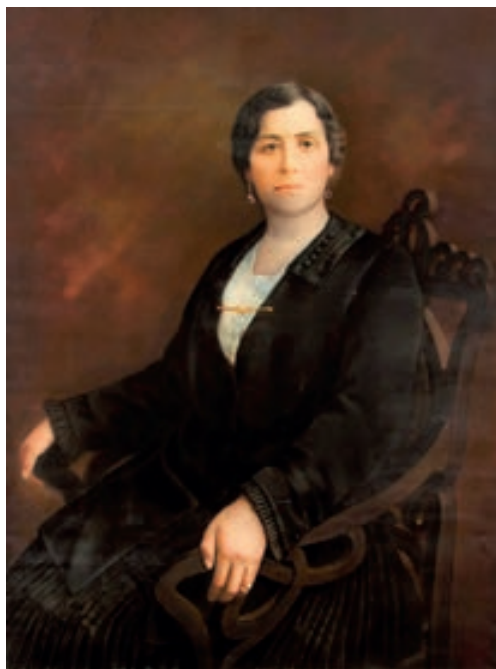
Fig. 15. E. Mariño. Retrato de dama no identificada. 130 x 95 cm. 1918. Fotografía iluminada con tiza pastel. Colección Jan Mulder.

son descritas como iluminadas por su estudio (Figuras 14 y 15). Este tipo de trabajo da cuenta del prestigio que el fotógrafo adquiere hacia 1928.