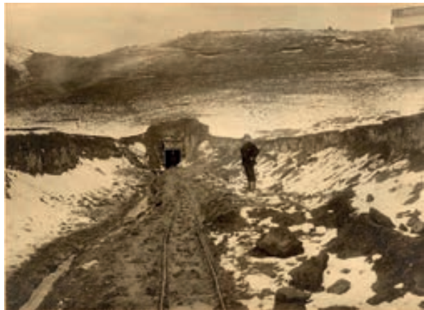
Fig.8. Túnel N°2, American Vanadium Company-Mina Ragra, 1911.