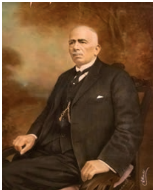
Fig. 14. E. Mariño. Retrato de caballero no identificado. 130 x 95 cm. 1918. Fotografía iluminada con tiza pastel. Colección Jan Mulder.