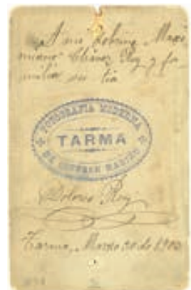
Fig.4: Sello. TARMA Fotografía Moderna de Esteban Mariño. Colección MMCC.