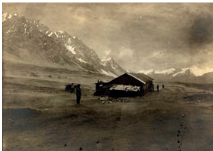
Fig.6: Campamento de arriba, American Vanadium Company-Mina Ragra, 1911.

auge minero. De acuerdo con lo investigado por Gómez, la importancia del cobre en el mercado internacional hizo inminente una estación del ferrocarril en esta localidad. Una vez inaugurada la Estación de la Esperanza en 1904, la Cerro de Pasco Mining Company ganó mayor presencia, incentivando su expansión, en 1906, a través de la compra de las principales minas de Morococha, (Pérez, 1997). De ese modo, como ha indicado Flores Galindo (1993), la Compañía se convirtió en un poder de facto, más fuerte que las autoridades locales, colocando sus intereses por encima de la población.