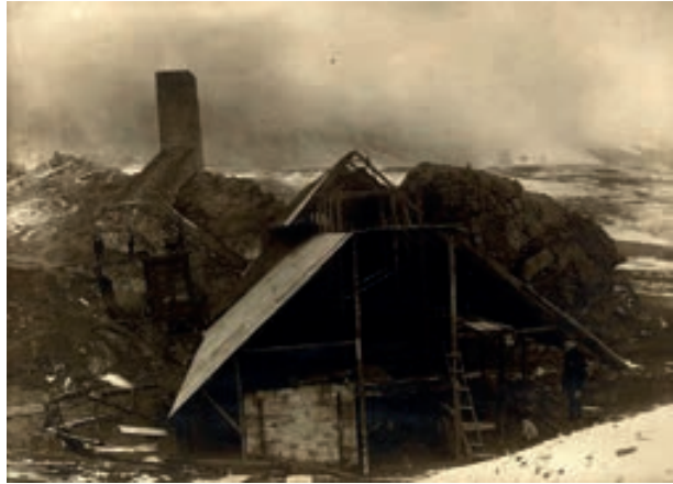
Fig.7. Vista exterior de los Hornos, American Vanadium Company-Mina Ragra, 1911. Science History Institute.

los registros fotográficos hallados que corresponden a este periodo, destacan un conjunto de tomas realizadas en 1911 por encargo de la empresa minera American Vanadium Company en la Mina Ragra, que fuera propiedad de la sociedad formada por Eulogio Fernandini y Antenor Rizo-Patrón hasta 1905 (Figuras 5-8), y que explotaba el mayor yacimiento del mineral conocido como patronita (descubierta por Antenor Rizo Patrón). El vanadio producto de la patronita fue crucial para dotar al acero (acero vanadiado) de cualidades que permitieran una utilización intensiva en la industria automovilística norteamericana. Destacan también dos tomas de la inauguración de un tramo del ferrocarril central, cuya ubicación hasta el momento no ha sido identificada y una vista de la estación ferroviaria de Smelter 1 fechada en 1908, fundición de gran importancia en la zona hasta la construcción de La Oroya en 1920-1921.