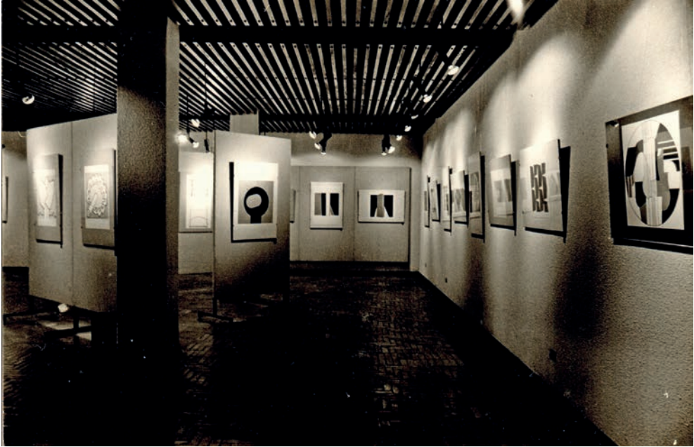
Figura 1. Grabados contemporáneos suizos, 1973.

Desde la época del IAC, Castrillón introduce en nuestro medio propuestas artísticas con el uso de nuevas tecnologías en los procesos de producción, como Arte y cibernética (1971), organizada en coordinación con el Centro de Arte y Comunicación, bajo la dirección del gestor cultural, crítico y curador Jorge Glusberg (Buenos Aires, 1932-2012). En esta línea de exposiciones, se realizó la VIII Internacional de Videoarte (1977), organizada por el CAyC, gracias a su amistad entablada con Glusberg. En esta se presentaron propuestas de artistas de Europa, Asia, Sudamérica y Norteamérica.