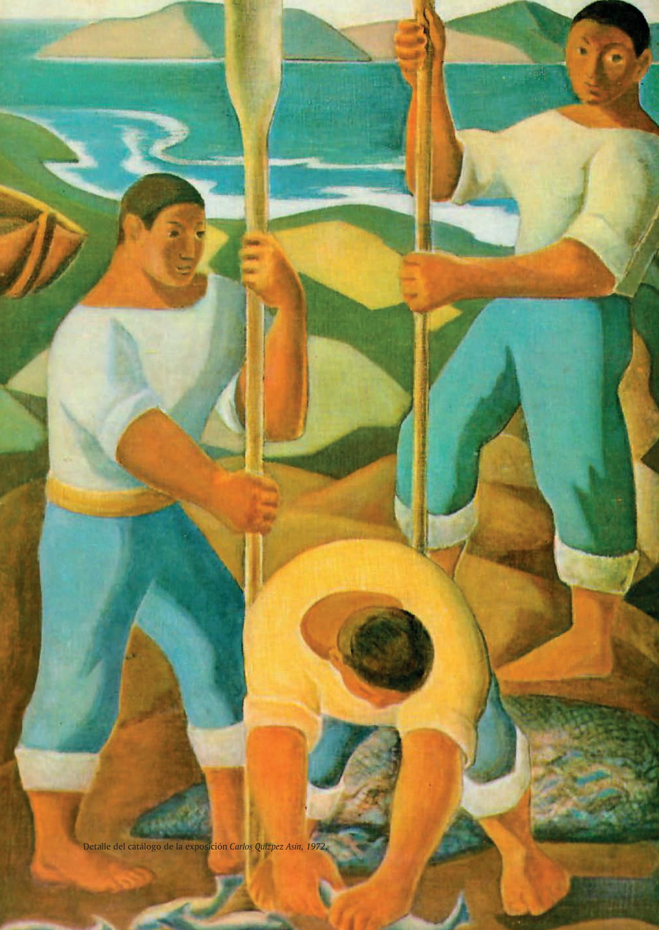
Detalle del catálogo de la exposición Carlos Quíñez Asín, 1972.