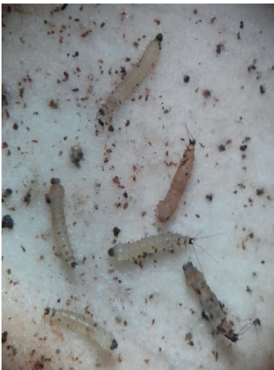
Figura 6. Larvas de Lutzomyia longipalpis afectadas por el piriproxifeno en el Tratamiento B ( 50 \text{ mg}\cdot\text{m}^{-2} ).