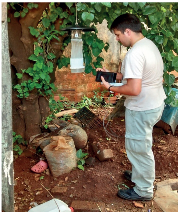
Figura 1. Captura de flebótomos con trampas de luz en el Posadas, Misiones, Argentina.

reunían las condiciones anteriormente descritas, entre las 18:00 y las 06:00 h, luego de retiradas se las trasladaron al laboratorio para comenzar con la alimentación y cría de los flebótomos utilizando el protocolo original de cría del Laboratorio de Transmisores de Leishmaniosis - Instituto Oswaldo Cruz (FIOCRUZ – Rio de Janeiro, Brasil) (Souza et al. , 1995) y adaptado al laboratorio del Instituto Municipal de Vigilancia y Control de Vectores, Municipalidad de Posadas, Misiones por Pettersen et al. (2015).