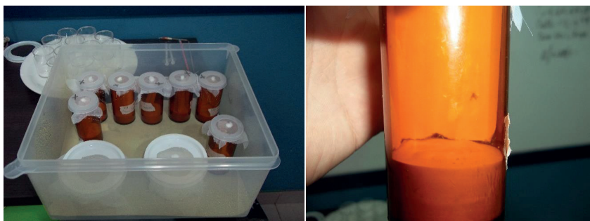
Figura 3. Hembras de Lutzomyia longipalpis separadas en pots individuales hasta la postura de huevos.