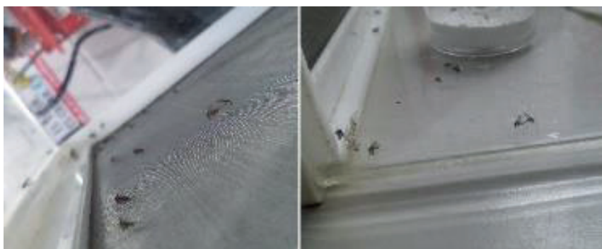
Figura 2. Jaulas para cría de flebótomos (a la izquierda se observan hembras alimentadas con el abdomen rojo y a la derecha hembra y macho copulando).

potes individuales hasta la postura de huevos (Fig. 3), eclosión de las larvas y posterior utilización para el ensayo. Una vez que la hembra colocaba los huevos y moría, se procedía a su identificación y determinación taxonómica, mediante observación de sus órganos genitales, y se seleccionaban solamente aquellas larvas que eclosionaban de huevos correspondientes a la especie Lu. longipalpis para la realización del ensayo.