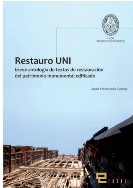
Figura 15. Carátula del libro de texto RestauRO-UNI. Breve Antología de Textos del Patrimonio Monumental Edificado [Fotografía del curso Restauración de Monumentos, 2012, Lima, Perú].