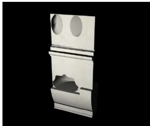
Figura 14. Reconstrucción tridimensional de un detalle de las arquerías del Claustro de La Pimienta en el Convento de San Francisco.