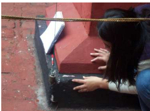
Figura 10. Estudiantes tomando medidas de detalle en el Convento de San Francisco [Fotografía del curso Restauración de Monumentos, 2009, Lima. Perú].