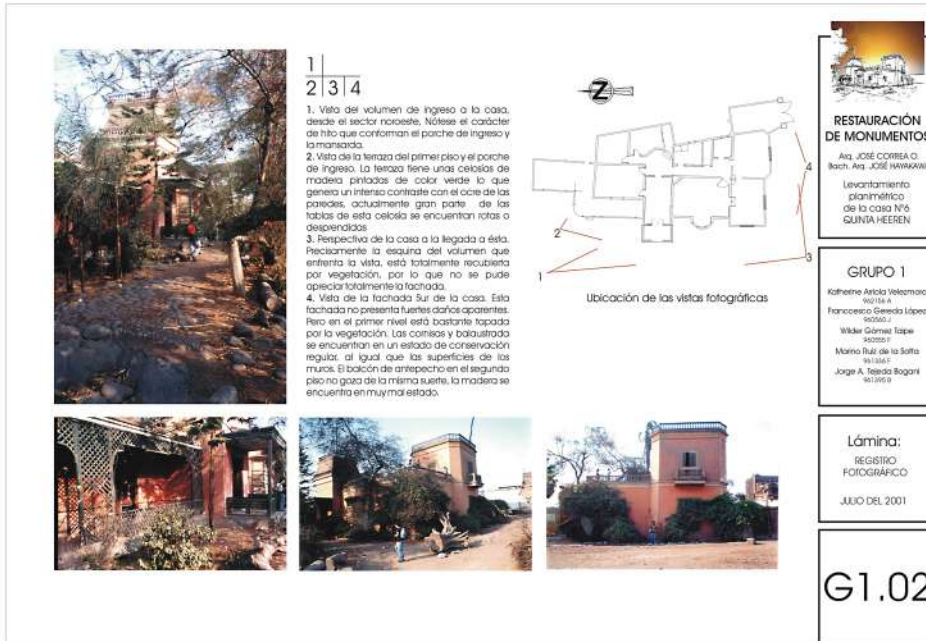
Figura 12. Lámina del estado actual de la primera planta de la Casa de la Asociación Nacional de Cesantes y Jubilados de Educación.