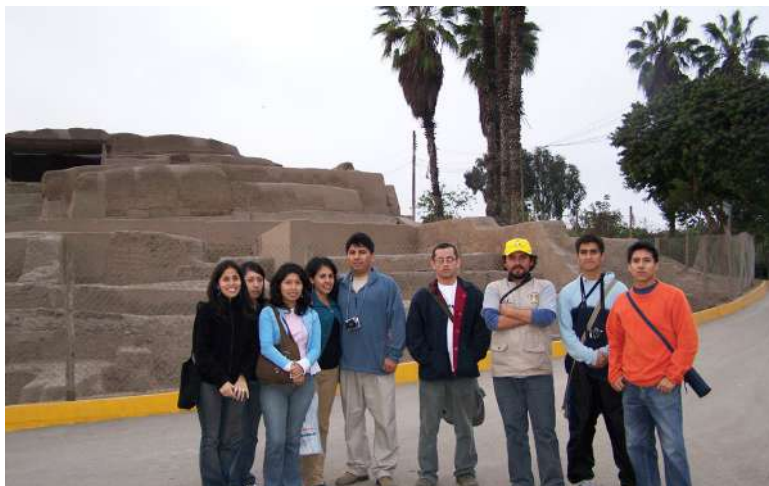
Figura 17. Estudiantes del curso Restauración de Monumentos, de la FAUA-UNI, luego de la visita a los edificios prehispánicos del Parque de las Leyendas en labores de conservación.