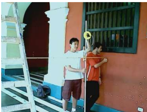
Figura 9. Estudiantes tomando medidas verticales en la Escuela Nacional de Bellas Artes del Perú [Fotografía del curso Restauración de Monumentos, 2005, Lima. Perú].