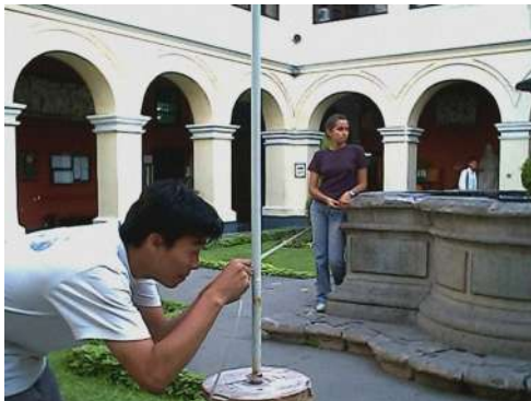
Figura 8. Estudiantes tomando medidas horizontales en la Escuela Nacional de Bellas Artes del Perú [Fotografía del curso Restauración de Monumentos, 2005, Lima. Perú].