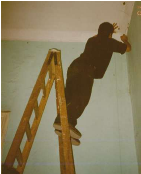
Figura 6. Estudiantes tomando medidas verticales en un pabellón de la Quinta Heeren [Fotografía del curso Restauración de Monumentos, 2001, Lima. Perú].