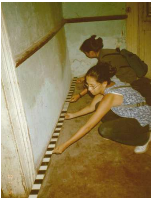
Figura 7. Estudiantes tomando medidas horizontales en un pabellón de la Quinta Heeren.