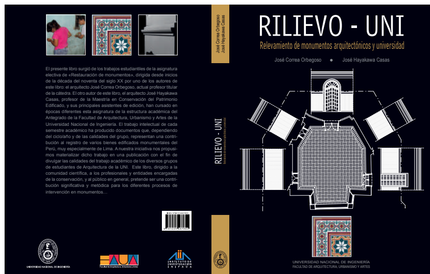
Figura 16. Carátula del libro Rilievo-UNI. Relevamiento de Monumentos Arquitectónicos y Universidad