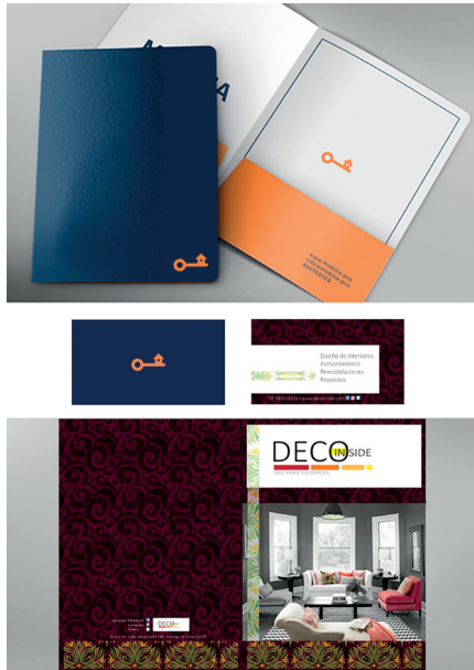
Figura 3. Papelería institucional (Asignatura Diseño Gráfico URP-Semestre 2017-0, por D. Iturrizaga y G. Romero)