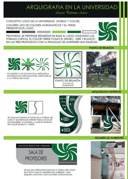
Figura 5. Propuesta final de arquigrafía (Asignatura Diseño Gráfico URP-Semestre 2016-II, por L. Palomino)