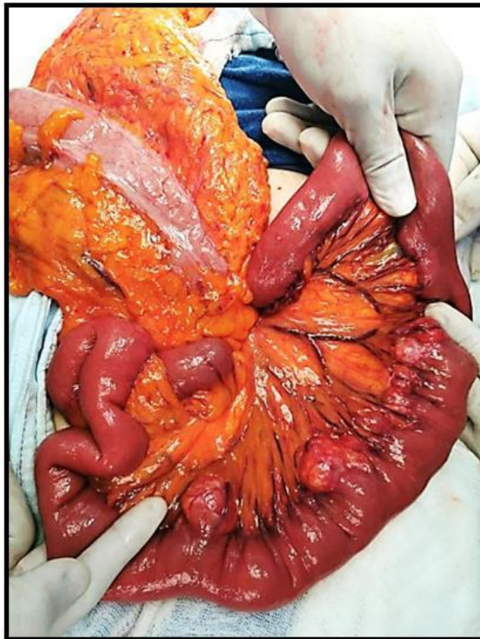
Figura 3. Múltiples divertículos yeyunales en borde mesentérico.