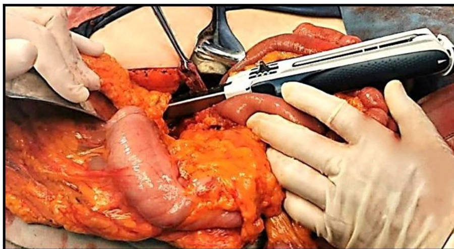
Figura 4. Diverticuloectomía mecánica.

700cc, lo calculado como permisible; se transfundió un concentrado eritrocitario. Se colocaron dos drenajes saratogas, uno dirigido a 3ra porción duodenal y otro hacia sitio de anastomosis. Se dio por terminado el procedimiento sin accidentes ni incidentes.