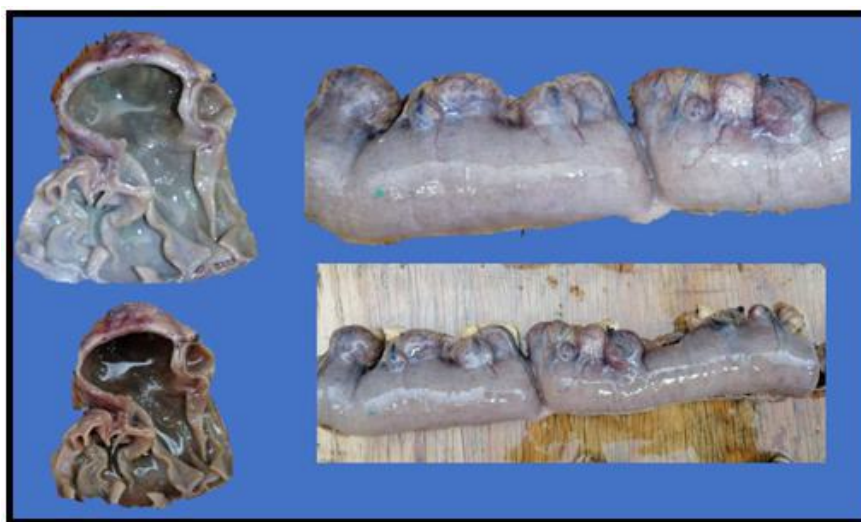
Figura 5. Divertículos yeyunales. Pieza patológica obtenida de resección quirúrgica.

posterior a cirugía se decidió su egreso al no presentar respuesta inflamatoria sistémica, ni elevación de marcadores inflamatorios y gasto bajo por drenajes. Durante seguimiento por consulta externa se refirió asintomática, sin datos de sangrado digestivo, tolerancia a vía oral, evacuaciones al corriente, fistula sin gasto. Reporte histopatológico de pieza quirúrgica (Figura 5): Enfermedad diverticular no complicada de intestino delgado, con vasos sanguíneos subserosos congestivos (Figura 6).