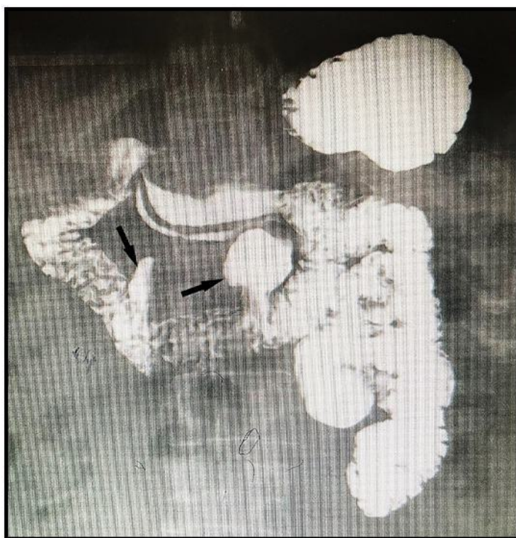
Figura 1. Tránsito intestinal evidenciando divertículos duodenales.

Tránsito intestinal 17/02/22: Dos divertículos gigantes en 3ª y 4ª porción de duodeno (Figura 1).