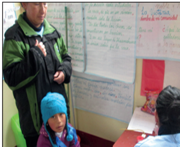
Foto 2. Colegio estatal del distrito La Victoria.