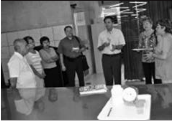
Visita de los evaluadores de la Red Internacional de evaluaciones (RIEV) a los laboratorios durante el Proceso de Acreditación.