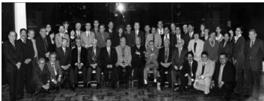
Los primeros docentes de la Facultad de Medicina Humana.

El primer concurso público realizado por la FAMURP para la provisión de plazas, en las diferentes categorías a fin de ingresar a la carrera docente en calidad de profesores ordinarios, fue en el año 2003; y en mayo del 2004, como parte del proceso de institucionalización, se llevaron a cabo las primeras elecciones para conformar el Consejo de Facultad, máximo Órgano de Gobierno de la Facultad, con representantes de profesores en las diferentes categorías y la presentación del tercio