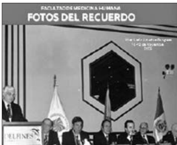
XXI Congreso Latinoamericano, en el Hotel los Delfines, 2005.

Docentes, estudiantes y personal no docente reciben capacitación para la atención en casos de desastres naturales.