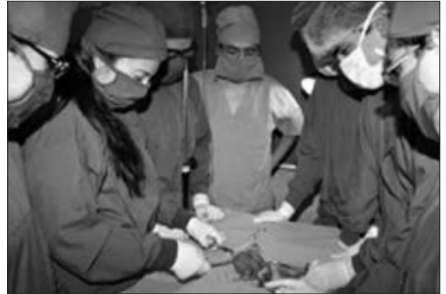
Prácticas de cirugía experimental y técnica operatoria.

El Laboratorio de Cirugía cuenta con equipos de alta tecnología, (un brazo robótico, equipos de cirugía laparoscópica, y ecógrafos).