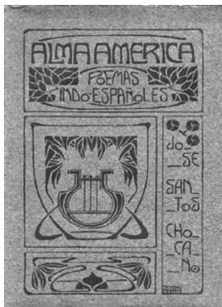
Figura 1. Portada de Alma América , con la firma de Juan Gris

Chocano's work is placed in the Peruvian context to later point out his encounter with Juan Gris; the request of this one to illustrate Alma América and how important it was in his initial