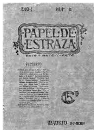
Figur 3. Revista Papel de estraza , Nº 3, 1904, Madrid