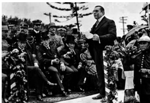
Figura 2. El poeta José Santos Chocano, declamando su «Himno al árbol», ante el presidente Leguía y sus ministros, en la ceremonia de plantación del árbol del Centenario, en la plaza Jorge Chávez, como parte de las celebraciones del Centenario de la Batalla de Ayacucho, 9 de diciembre de 1924.

Chocano había llegado a Madrid en 1905. Ya tenía en mente publicar en la península el libro que estaba trabajando buen tiempo y que encerraba en sus páginas la historia y los paisajes de América. La obra del poeta peruano había tenido buena acogida en tierras americanas. Buscaba ahora consolidarse en el «ruedo ibérico». Por su parte, Juan González –todavía no era el Juan Gris de la historia– vivía su etapa inicial, anterior a su paso por París donde conocería la gloria como maestro del cubismo. Era, por decirlo, un joven muy talentoso, pero andaba en plena búsqueda de un estilo.