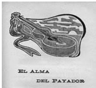
Ilustración 1: del poema «El Alma del payador», José Santos Chocano, Alma América , Madrid, 1906 .