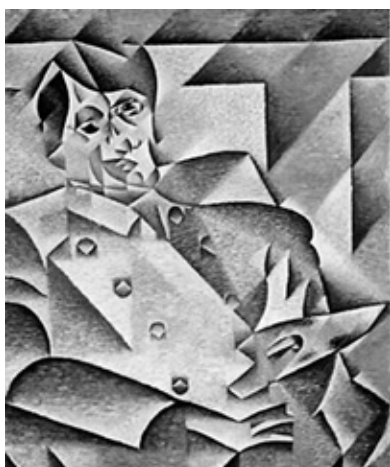
Figura 3. Retrato de Picasso , óleo sobre lienzo 83 x 74 cm. Art institute of Chicago

No podemos tomar en serio esta noticia porque ni siquiera acertó en la nacionalidad del poeta, pero este error, igualmente, lo vemos en un trabajo monumental publicado en 2012 por la Fundación Telefónica, titulado Colección cubista de Telefónica . Ahí se señala que «Juan Gris comenzó a llamarse Juan Gris, y a firmar con este nombre, al ilustrar el libro de poemas de José Santos Chocano, Alma América , impreso por primera vez en 1906» (Carmona, 2012, p. 22).