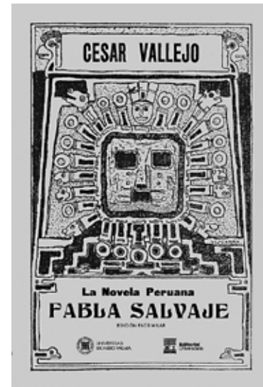
Figura 1. Fabla salvaje (1923) relata la historia de Balta, un hombre que a partir de la rotura de un espejo varía su comportamiento sustancialmente

Con respecto al personaje modelado, De Aguiar explica que «ofrecen una complejidad muy acentuada, y el novelista tiene que dedicarle atención vigilante, esforzándose por caracterizarlos en diversos aspectos», añadirá luego que estos personajes muestran