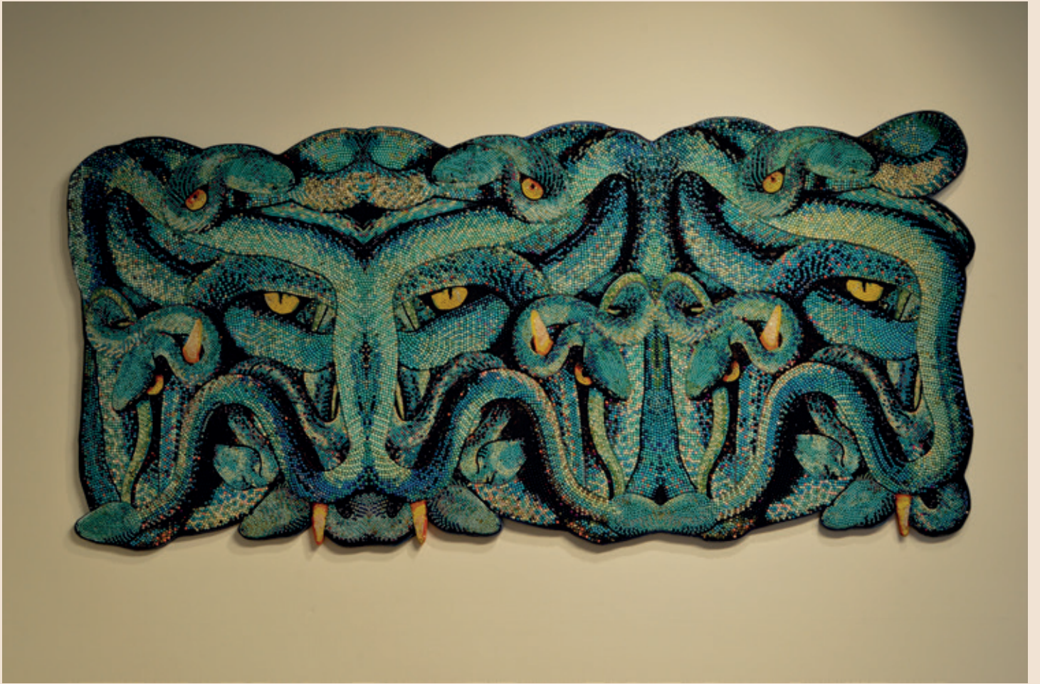
Los antiguos mayas