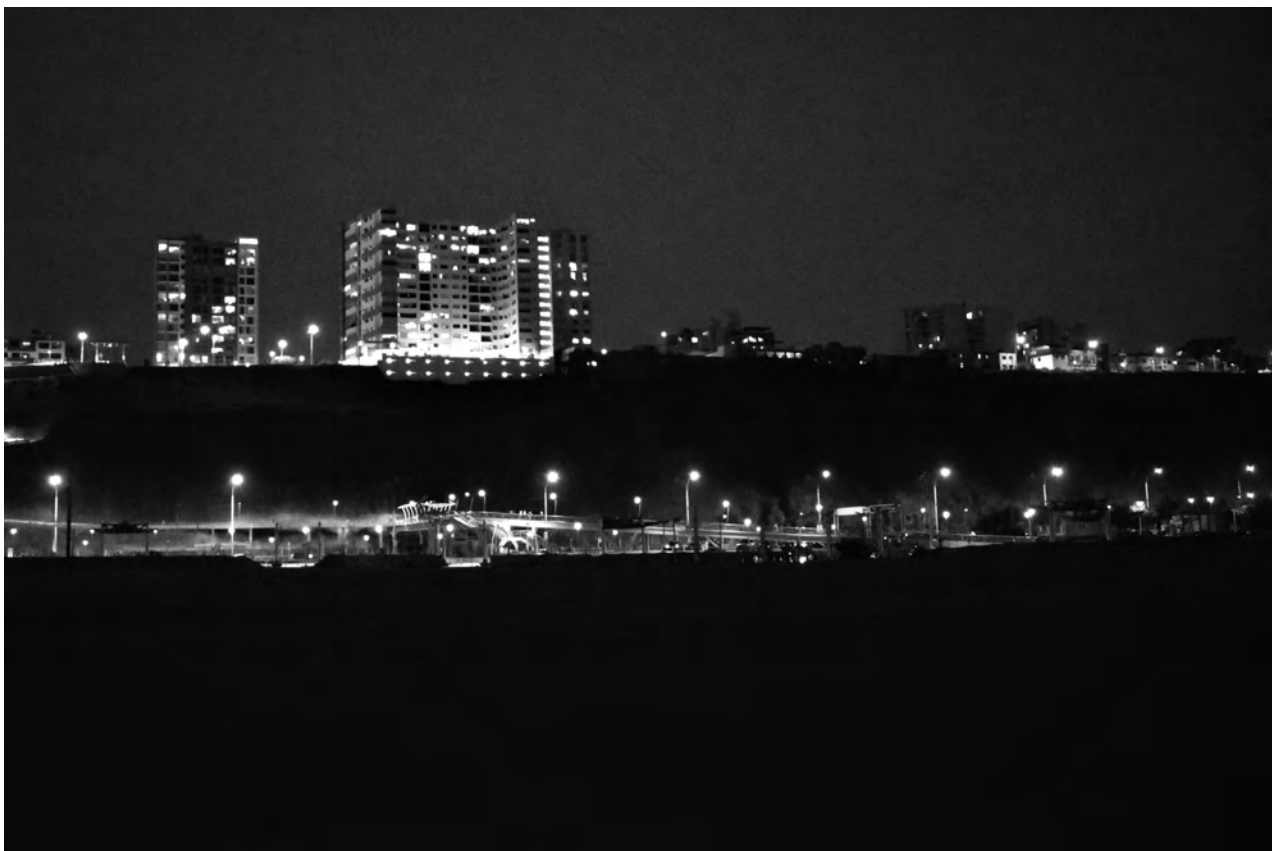
La luz es la influencia más importante en nuestra percepción visual del mundo. Foto: Melissa Santos Gonzales, alumna del Taller de fotografía. Febrero 2022.

Esta actividad es la llamada "teoría de las neuronas", según la cual la cabeza estaba formada por neuronas