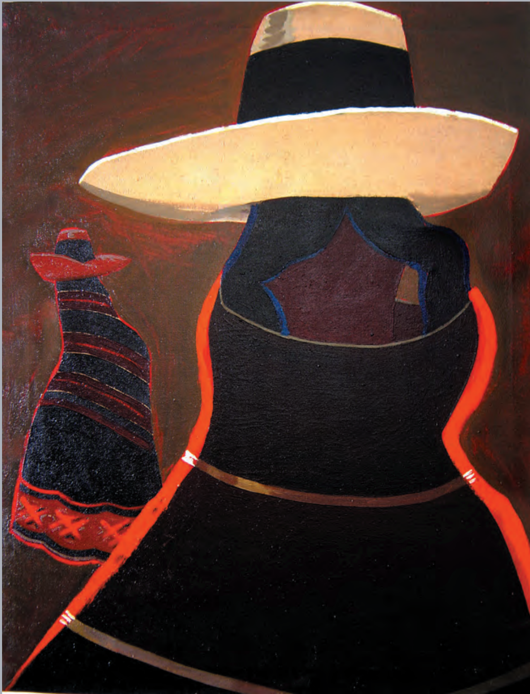
Mujer de la Oroya , 1954. Óleo. 73x 60 cm. Fam. Pantigoso.