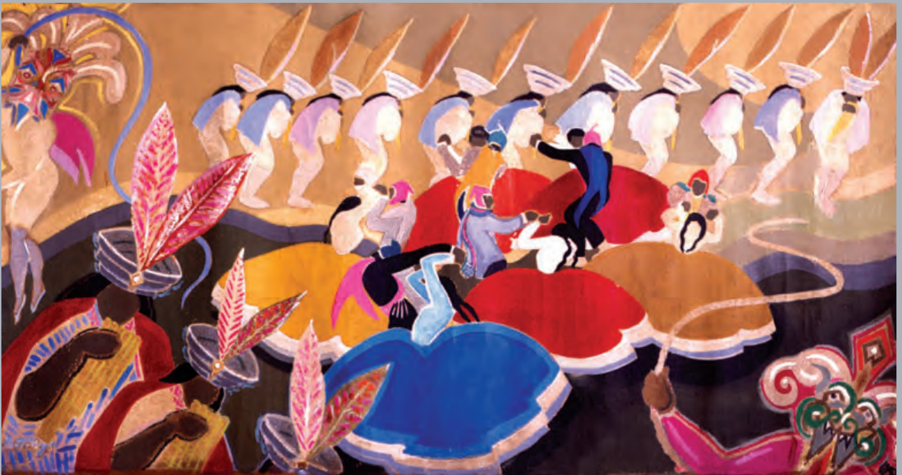
Carnaval Colla , 1937. Óleo. 89x183 cm. Fam. Pantigoso. (Caratula)