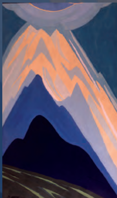
Panteísmo, 1940. Témpera. 60x35 cm. Fam. Pantigoso.