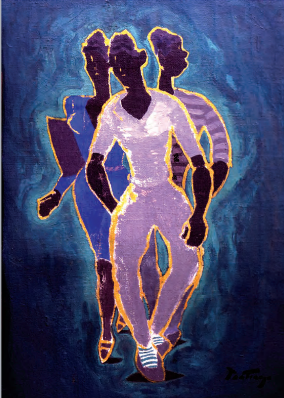
La Quimba, 1940. Óleo. 100x 74 cm. Fam. Pantigoso.