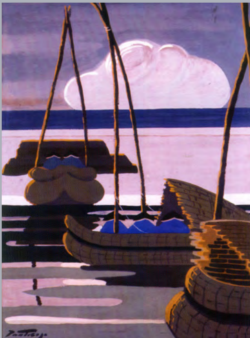
Titicaca (II) , 1937. Témpera. 79 x 60 cm. Colección del Banco Central de Reserva.