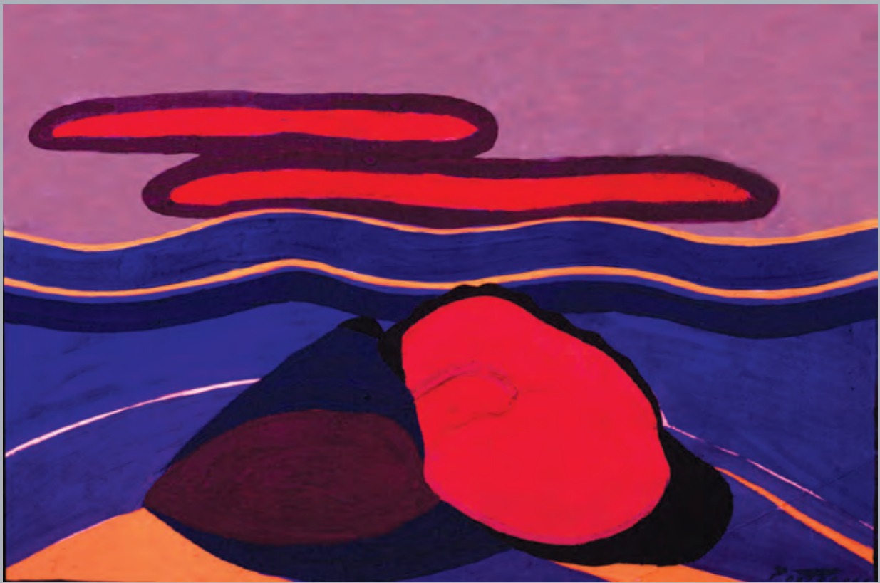
Atardecer en el lago , 1983. Témpera. 32.5x50 cm. Fam. Pantigoso.