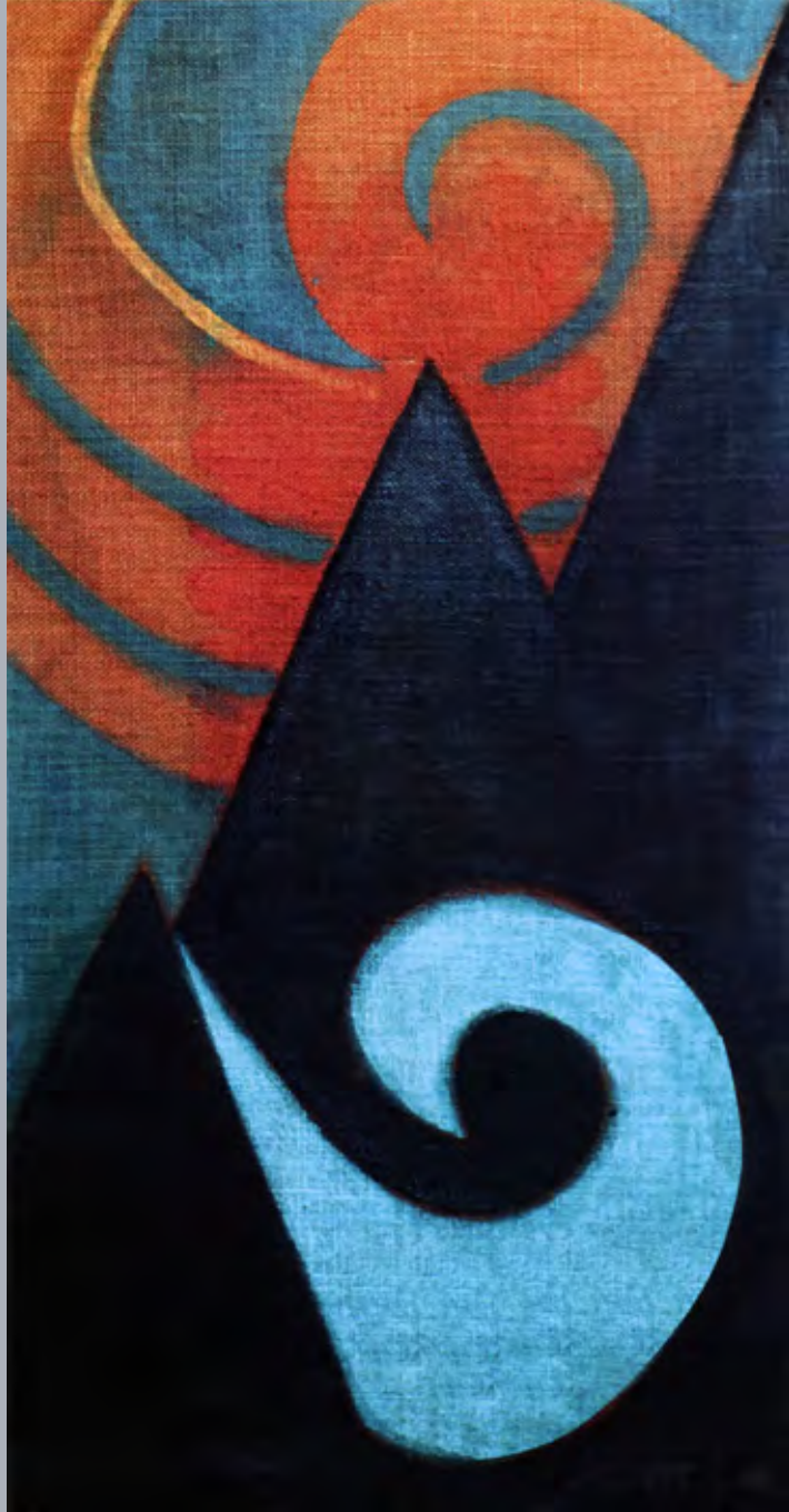
Ópera de piedra , 1981. Óleo sobre yute. 100x 50 cm. Fam. Pantigoso.