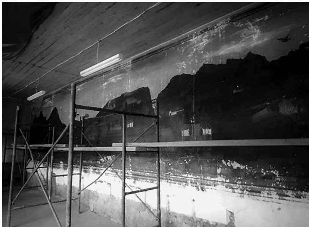
Fig. 2. Restauración y puesta en valor de la pintura mural que corresponde a las primeras décadas del siglo XX, atribuida al escultor y pintor Benjamín Mendizábal Vizcarra 3 .