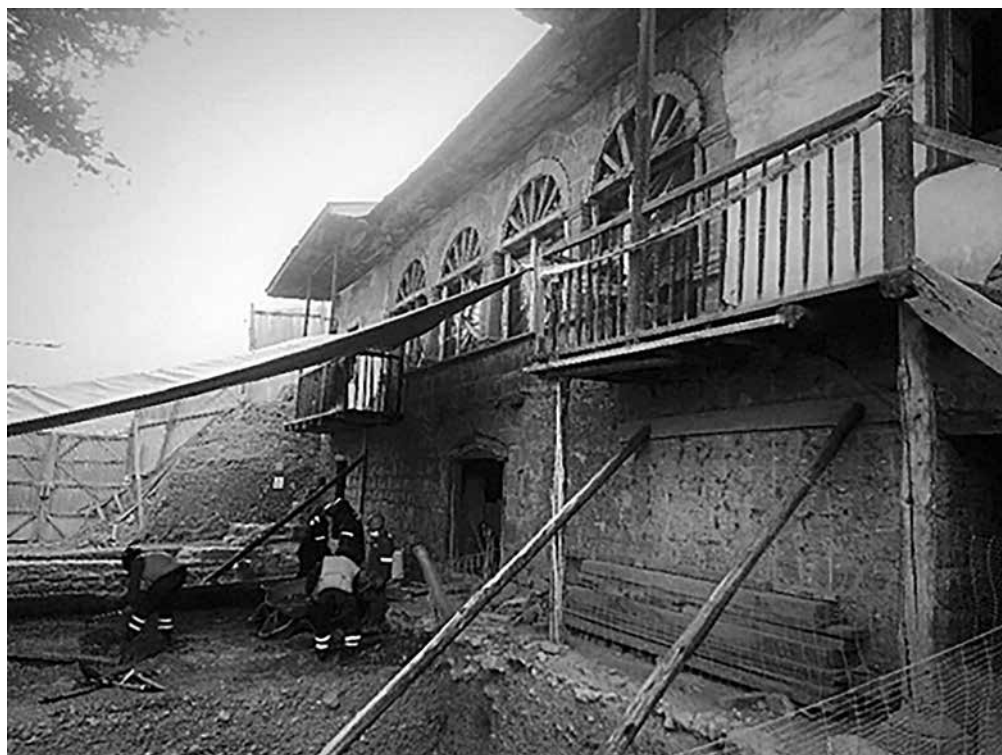
Fig. 3. Trabajos de recuperación integral de la casa Accomoco por el personal de la Dirección Desconcentrada de Cultura de Cusco.