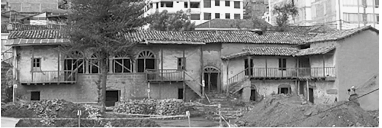
Fig. 4. Trabajos de recuperación integral de la casa Accomoco.

cultural con el compromiso de tramitar no solo la viabilidad del proyecto y ejecutar la obra de reubicación y restauración integral del referido inmueble que permitirá la transitabilidad vehicular, sino también de la realización de actividades culturales y artísticas en beneficio de la población.