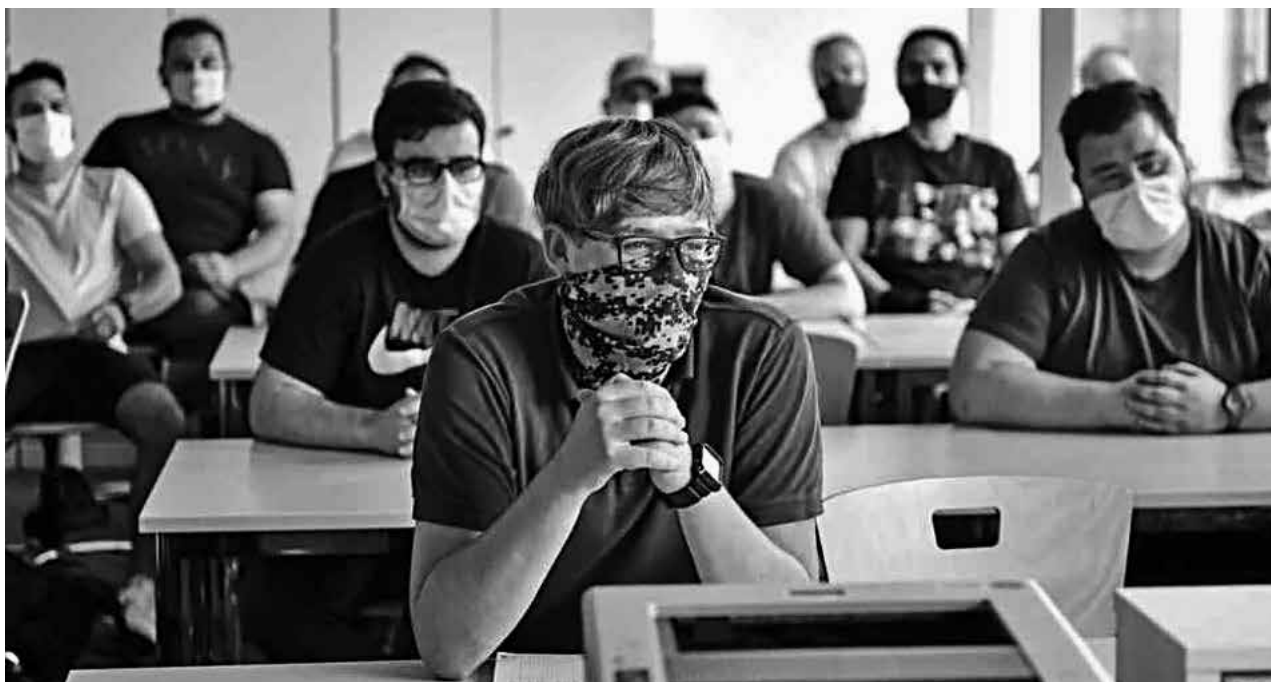
Fig. 3

sería conveniente contrastar estos resultados con estudios sobre la calidad de sueño en un período poscuarentena.