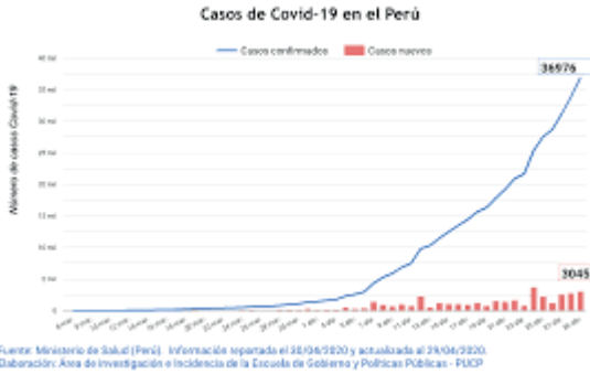
Gráfico 3: Metáfora de imagen sobre el término curva

Nos encontramos ante una metáfora de imagen en la que se utiliza una figura geométrica para representar el comportamiento de los datos estadísticos. Se habla entonces de la curva que sube o que baja en función de los datos actualizados.