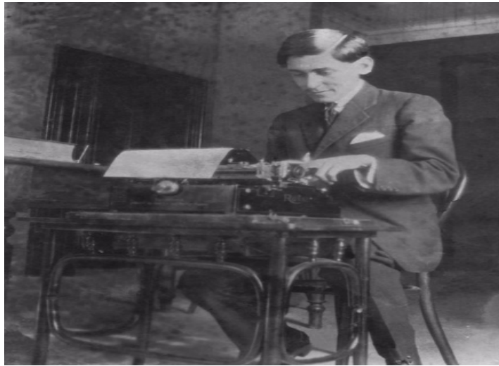
Imagen1 .José Carlos Mariátegui.