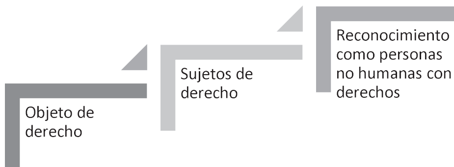
Fig. 1: Evolución del reconocimiento de derechos de los animales

Para el caso específico de los animales ha habido una evolución del reconocimiento de los derechos de los animales primero considerándolos sujetos de derecho y luego como personas no humanas, tal como se muestra en la figura 1. Claro está que el proceso todavía es incipiente y dispar por la fuerte reticencia existente (Pezzetta, 2018).